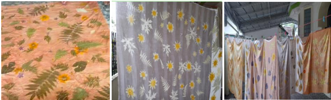
Gambar 3. Hasil Karya Ecoprint

Setelah memahami teknik dasar, pelatihan berlanjut pada pengembangan produk. Peserta diajak mengeksplorasi variasi desain, kombinasi warna alami, dan diversifikasi produk seperti syal, tas, taplak meja, atau sarung bantal. Pendampingan juga mencakup standar mutu, teknik finishing, dan pengemasan yang menarik (Asmara, 2020). Dengan pendekatan ini, Ibu-Ibu PKK tidak hanya mampu menghasilkan produk ecoprint yang berkualitas, tetapi juga memiliki keterampilan untuk mengembangkan desain yang unik dan bernilai jual tinggi.