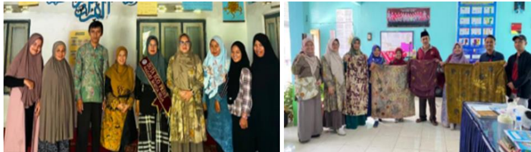
Gambar 5. Pemilihan Duta Eco Print

Pemilihan Duta Ecoprint bertujuan menghadirkan sosok perwakilan yang mampu menjadi penggerak, komunikator, dan inspirator dalam mengembangkan usaha ecoprint di masyarakat. Duta yang terpilih diharapkan memiliki keterampilan teknis dasar pembuatan ecoprint, kemampuan komunikasi publik yang baik, serta komitmen untuk aktif melakukan sosialisasi dan mengajak warga terlibat (Irwan, et al 2021). Proses seleksi dilakukan secara terbuka dengan mempertimbangkan integritas, kepemimpinan, dan keterlibatan di komunitas.