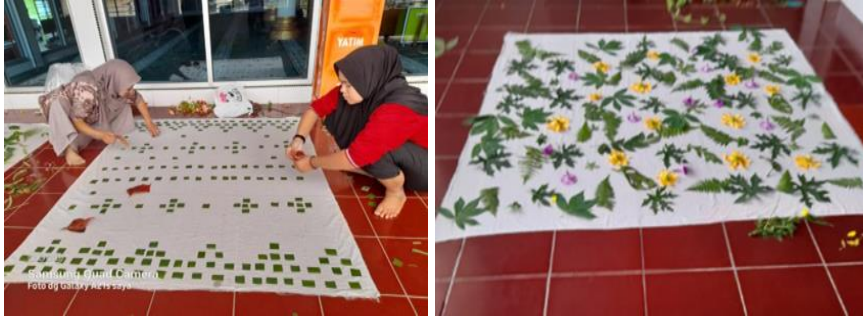
Gambar 2. Proses Pembuatan Pola Ecoprint

Setelah memahami teknik dasar, pelatihan berlanjut pada pengembangan produk. Peserta diajak mengeksplorasi variasi desain, kombinasi warna alami, dan diversifikasi produk seperti syal, tas, taplak meja, atau sarung bantal. Pendampingan juga mencakup standar mutu, teknik finishing, dan pengemasan yang menarik (Asmara, 2020). Dengan pendekatan ini, Ibu-Ibu PKK tidak hanya mampu menghasilkan produk ecoprint yang berkualitas, tetapi juga memiliki keterampilan untuk mengembangkan desain yang unik dan bernilai jual tinggi.