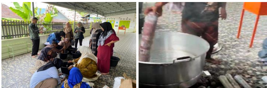
Gambar 1. Proses Steaming Untuk Mengunci Motif Pada Kain

Pelatihan pembuatan ecoprint diawali dengan pengenalan konsep dasar, manfaat, dan potensi pasarnya. Peserta diperkenalkan pada bahan baku utama seperti kain serat alami (katun, sutra, linen) serta daun dan bunga lokal yang kaya pigmen, misalnya jati, ketapang, atau kenikir. Tahap persiapan meliputi pembersihan kain ( scouring ), perendaman dengan larutan tanin, dan proses mordan untuk mengikat warna (Rassa, et al 2023). Peserta kemudian mempraktikkan penyusunan motif, teknik penggulungan atau pengikatan, serta proses penguapan untuk memindahkan warna dan bentuk daun ke kain.