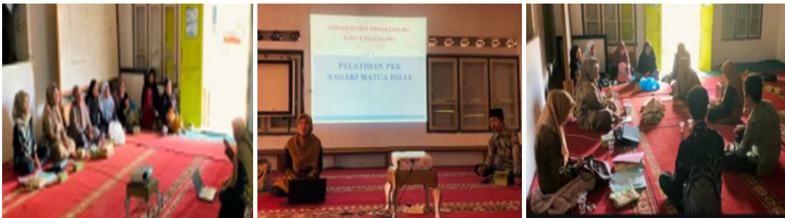
Gambar 4. Pelatihan Pemasaran

Pelatihan pemasaran dimulai dengan membangun identitas merek yang kuat, mencakup nama, logo, cerita produk, dan kemasan ramah lingkungan yang menonjolkan nilai alam dan budaya lokal (Putra, et al 2024). Peserta diajak memahami pentingnya kualitas produk, penentuan harga yang adil, serta kemasan yang menarik untuk meningkatkan daya tarik pembeli.