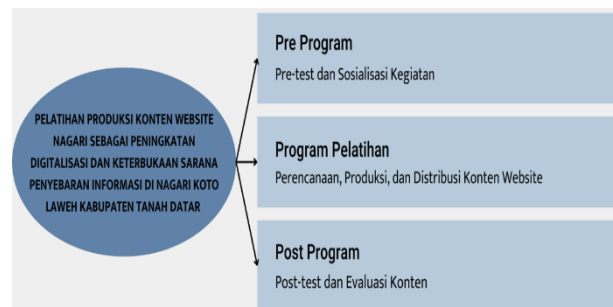
Gambar 2. Tahap Pelaksanaan Kegiatan Pengabdian

Metode pelaksanaan pengabdian menggunakan prinsip partisipatif yang menempatkan mitra sebagai subjek aktif dalam pergerakan infrastruktur digital di daerahnya. Metode ini berorientasi pemberdayaan masyarakat atau pendekatan Participatory Action Research (PAR) yang memenuhi kebutuhan dan penyelesaian masalah di tengah-tengah mitra (Afandi et al., 2022). Selain itu, program pengabdian kepada masyarakat yang akan dijalankan ini diukur sesuai mekanisme rancangan pelatihan produksi konten dari beberapa tahapan yang digambarkan pada gambar berikut: