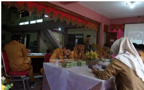
Gambar 7. Peserta Melakukan Post-Test Pasca Pelaksanaan Pelatihan

berupa menyediakan pertanyaan terbuka dan tertutup tentang digitalisasi nagari, proses produksi konten, dan keterbukaan informasi publik.