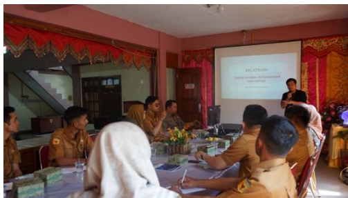
Gambar 5. Pelaksanaan Pelatihan Produksi Konten pada Website

serta beberapa pendekatan yang mesti ada dalam pembuatan berita tersebut. Narasumber menjelaskan pentingnya teknik penggunaan kamera sederhana berupa pemanfaatan gawai yang ada ( smartphone ) untuk pengabdian kegiatan. Kamera sederhana yang ada pada gawai masing-masing bisa digunakan untuk mengambil foto kegiatan sejauh pemotret mampu melakukan pengaturan atas pencahayaannya.