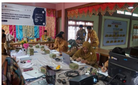
Gambar 6. Peserta Melakukan Praktek Pembuatan Konten Menggunakan Alat Sederhana (Handphone) dan Pembuatan Berita

Setelah materi pelatihan disampaikan oleh narasumber, maka dilanjutkan dengan proses praktek produksi konten website berupa foto dan teks foto. Peserta pelatihan diminta untuk mempraktikkan teknik yang telah dipaparkan oleh narasumber, kemudian mengambil foto kegiatan yang sedang dilakukan dengan memperhatikan teknik kamera dan pencahayaan dilakukan. Setelah itu peserta didampingi untuk melakukan pengeditan atas tangkapan gambar yang telah dilakukan. Hasil praktek yang dikerjakan peserta kemudian dikumpulkan untuk kemudian dievaluasi oleh narasumber.