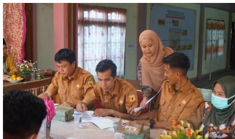
Gambar 4. Pelaksanaan Pre-Test Kepada Peserta Sebelum Pelatihan

Setelah sosialisasi kegiatan dilaksanakan, tim pengabdian mengadakan pre-test kepada peserta yakni perangkat nagari tentang pengetahuan mereka pada pembuatan konten dan pengelolaan website nagari. Pre-test dibuka dengan menyediakan pertanyaan-pertanyaan terbuka dan tertutup. Tahapan yang dilalui mitra untuk menjawab pertanyaan yang telah disediakan oleh tim pengabdian. Pertanyaan tersebut bersifat tertutup dan terbuka yang terdiri atas komponen indikator digitalisasi nagari, proses produksi konten, dan keterbukaan informasi publik.