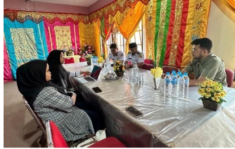
Gambar 3. Pelaksanaan FGD Tim Pengabdian dengan Mitra