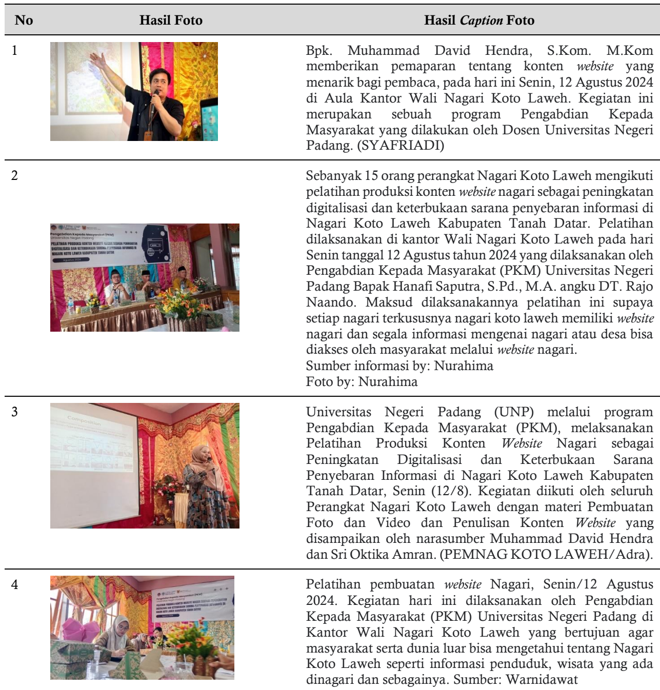
Tabel 1. Hasil Foto dan Caption oleh Mitra

publik. Hanya saja, dalam proses ini disimulasikan dengan mengunggah hasil produksi peserta menggunakan link yang telah disediakan oleh tim pengabdian. Hasil foto dan teks foto yang dilakukan oleh sebagian peserta dapat dilihat pada tabel di bawah.