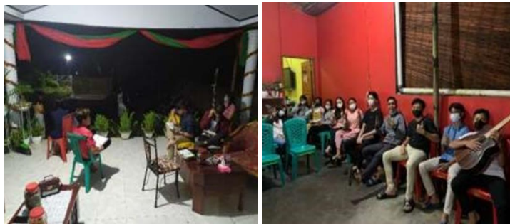
Gambar 2. Kegiatan Pemuda Remaja GMIM Ruth Matungkas

Desa Matungkas merupakan salah satu desa yang berada di Kecamatan Dimembe, Kabupaten Minahasa Utara, dengan kondisi geografis yang relatif datar dan lokasi yang strategis karena dekat dengan pusat perkantoran kabupaten. Perkembangan kawasan perumahan di desa ini cukup pesat, sehingga dihuni oleh masyarakat dengan latar belakang sosial dan ekonomi yang beragam. Fasilitas umum di Desa Matungkas tergolong memadai, seperti sekolah, tempat ibadah, kios dan toko, serta sarana pendukung lainnya.