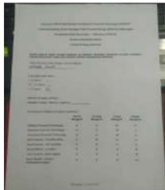
Gambar 5. Kuesioner Peserta – Hasil Pretest dan Postest

Hasil pengukuran awal (pre-test) menunjukkan bahwa tingkat literasi fintech peserta masih relatif rendah. Dari 20 peserta, hanya 3 orang (15%) yang menyatakan memahami konsep dasar fintech dan jenis layanan keuangan digital yang legal. Sebagian besar peserta belum mampu membedakan antara fintech legal dan ilegal, serta belum memahami risiko dan manfaat penggunaan layanan keuangan digital.