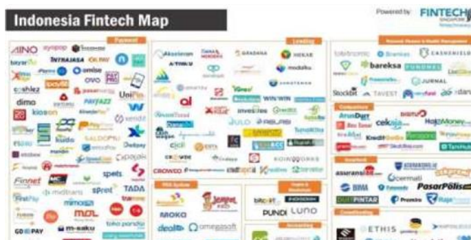
Gambar 4. Jenis-jenis Fintech yang dikenalkan dalam kegiatan

Pelaksanaan kegiatan dilakukan melalui beberapa tahapan sebagai berikut: (1) Tahap Persiapan: meliputi survei awal untuk mengidentifikasi tingkat literasi fintech dan kebutuhan mitra, koordinasi dengan pihak gereja dan pemerintah desa, penyusunan materi pelatihan, serta penyusunan instrumen evaluasi. (2) Tahap Pelaksanaan: berupa sosialisasi konsep fintech, pemaparan jenis layanan keuangan digital, demonstrasi penggunaan aplikasi, serta pelatihan langsung pembuatan dan penggunaan akun fintech sesuai kebutuhan peserta. (3) Tahap Evaluasi dan Pendampingan Lanjutan: dilakukan melalui pengukuran pre-test dan post-test, observasi keterampilan peserta, diskusi reflektif, serta pendampingan dan monitoring selama satu bulan setelah kegiatan.