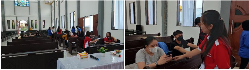
Gambar 6. Demonstrasi dari Peserta

Selain peningkatan pengetahuan, kegiatan ini juga berdampak pada perubahan sikap dan keterampilan peserta. Berdasarkan hasil observasi dan diskusi, peserta menunjukkan peningkatan minat untuk memanfaatkan layanan keuangan digital secara produktif, seperti menabung di bank digital dan mulai mengenal investasi sederhana. Peserta juga menjadi lebih kritis dalam memilih layanan fintech dengan memperhatikan aspek legalitas dan keamanan.