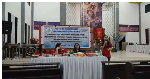
Gambar 3. Penyampaian materi dan pelatihan