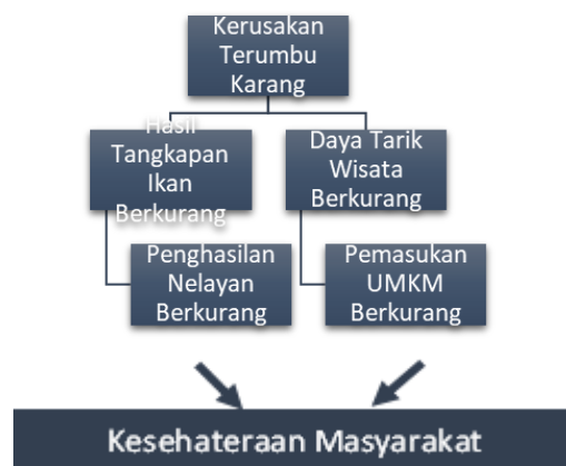
Gambar 2. Bagan Dampak Kerusakan Terumbu Karang

Degradasi terumbu karang di Teluk Kabung Selatan menimbulkan dampak ekologis dan sosial ekonomi yang signifikan. Secara ekologis, hal ini mengganggu keseimbangan ekosistem laut, mengurangi habitat ikan, dan menurunkan populasi ikan. Dampak ekonomi yang menyertainya adalah penurunan hasil tangkapan nelayan dan berkurangnya daya tarik wisata bahari, yang pada akhirnya memengaruhi pendapatan UMKM lokal dan kesejahteraan masyarakat, seperti yang digambarkan pada Gambar 2. Faktor utama penyebab kerusakan terumbu karang diidentifikasi meliputi pencemaran laut akibat sampah rumah tangga, penangkapan ikan secara ilegal (misalnya dengan bom), dan perubahan iklim global. Namun akar masalah yang paling krusial adalah kurangnya pengawasan dan kesadaran masyarakat akan pentingnya pelestarian terumbu karang.