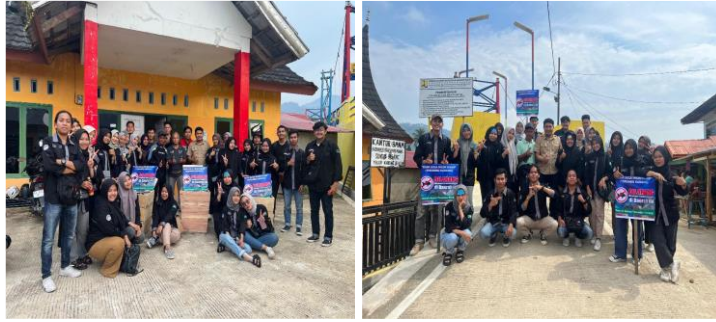
Gambar 5. Kampanye Penyadaran Masyarakat

Observasi lapangan yang dilakukan oleh tim pelaksana PkM mengidentifikasi beragam potensi ekowisata di Sungai Pisang, meliputi budidaya pisang, budidaya terumbu karang, kekayaan ikan, wisata antar pulau, dan budidaya mangrove yang telah menghasilkan produk turunan seperti sirup dan peyek mangrove. Potensi-potensi ini merupakan modal kuat untuk menarik wisatawan. Namun di sisi lain, beberapa tantangan signifikan juga teridentifikasi, antara lain: 1) belum adanya produk kekhasan daerah yang dikembangkan secara optimal, 2) keterbatasan sarana dan prasarana pariwisata, 3) akses jalan menuju Sungai Pisang yang masih sulit ditempuh, 4) pengelolaan sampah yang belum maksimal, 5) masih terjadi praktik penangkapan ikan menggunakan potas, mengakibatkan kerusakan ekosistem laut, dan 6) belum maksimalnya pengembangan promosi wisata secara digital.