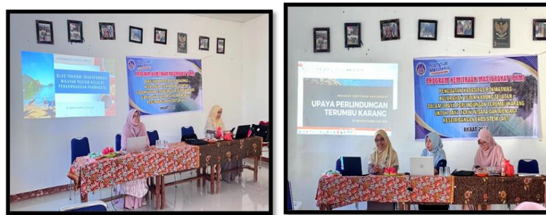
Gambar 7. Penyampaian Materi Pelatihan oleh Narasumber