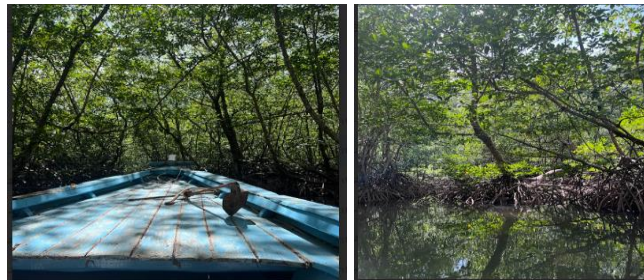
Gambar 3. Hutan Mangrove Sungai Pisang

Peningkatan kunjungan wisatawan ke Sumatera Barat pada tahun 2024 menunjukkan tren positif di sektor pariwisata. Data dari Badan Pusat Statistik (BPS) pada Juli 2024 mencatat peningkatan sebesar 28,18% dibandingkan bulan sebelumnya, dan sekitar 20% dibandingkan dengan periode yang sama tahun sebelumnya. Hal ini, meskipun membawa dampak ekonomi positif, juga menimbulkan tantangan lingkungan yang signifikan, mendorong urgensi penerapan konsep pariwisata berwawasan lingkungan atau ekowisata. Ekowisata adalah pendekatan yang memadukan pariwisata dengan pelestarian lingkungan dan penghormatan terhadap budaya lokal serta memberikan kontribusi peningkatan kesejahteraan masyarakat lokal ( Prasetya & Harahap, 2024 ; Wahyuningtyas et al., 2022 ).