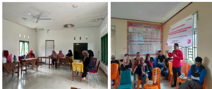
Gambar 4. Koordinasi dan Sosialisasi Perlindungan Terumbu Karang

Pada bulan Agustus-Oktober 2024, tim pelaksana PkM, didanai melalui Program Kemitraan Masyarakat Universitas Negeri Padang (RKAAT 2024), berinisiatif mendorong promosi ekowisata di Sungai Pisang, Kelurahan Teluk Kabung Selatan Kota Padang. Inisiatif ini bertujuan mengedukasi Pokmaswas Sungai Pisang agar berperan aktif dalam menjaga ekosistem sambil menikmati keindahan alam. Kegiatan ini dimulai dengan melakukan koordinasi dan sosialisasi dengan stakeholder setempat, dan juga melibatkan LSM JEMARI Sakato, untuk mendorong upaya perlindungan terumbu karang. Kampanye penyadaran masyarakat juga dilakukan dengan melibatkan Pokmaswas dan mahasiswa Sosiologi UNP, berupa pemasangan spanduk himbauan untuk menjaga terumbu karang.