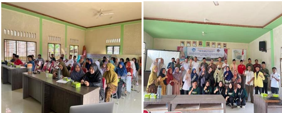
Gambar 4. Kegiatan Pelatihan berlangsung

Secara keseluruhan, output nyata program ini berupa peningkatan kompetensi pedagogik guru dan inisiasi fondasi manajemen kelembagaan menunjukkan bahwa fondasi yang kokoh untuk memberantas rendahnya literasi al Qur`an telah terbentuk di Kenagarian Aur Duri. Ketika guru menjadi lebih kompeten dan mampu merencanakan pembelajaran secara efektif, kualitas proses pembelajaran otomatis meningkat, yang pada gilirannya akan mencetak santri yang mahir dalam baca tulis al Qur`an (Cahyo, 2023). Peningkatan kualitas ini memastikan misi pemberantasan buta aksara dapat tercapai secara berkelanjutan. Hal ini membuktikan bahwa pelatihan dengan fokus ganda—pada Peningkatan Kualitas Sumber Daya Manusia (SDM) dan penguatan Sistem Kelembagaan—adalah strategi yang paling efektif dan holistik untuk meningkatkan kualitas dan menjamin keberlanjutan TPQ dalam jangka panjang. Pendekatan ini memastikan bahwa perbaikan bukan hanya bersifat insidental pada individu, melainkan menjadi perubahan sistematis pada organisasi TPQ di tingkat nagari. Foto-foto kegiatan pengabdian dapat dilihat melalui gambar berikut ini: