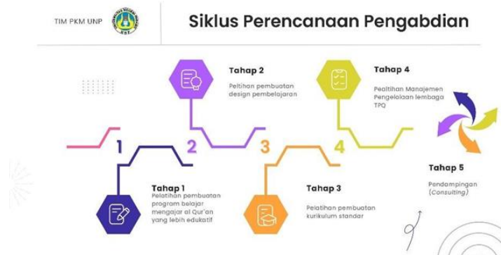
Gambar 1. Skema Tahapan Pelatihan ( mentoring )

Tahap ini merupakan tindak lanjut (follow-up) untuk memastikan keberlanjutan dan implementasi mandiri dari empat tahap sebelumnya. Tim pengabdian melakukan kunjungan luring (tatap muka) dan konsultasi daring berkelanjutan. Fokusnya adalah membantu guru menerapkan RPP dan Kurikulum baru di kelas, serta memonitor pelaksanaan fungsi struktur manajemen yang baru dibentuk agar lembaga TPQ dapat berdirikan dan mandiri. Output dari tahapan ini adalah Lembaga TPQ mampu menjalankan roda kelembagaannya secara mandiri dan mempertahankan standar kompetensi guru yang telah dilatih.