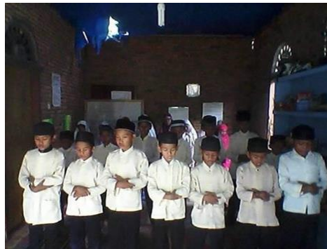
Gambar 3. Kegiatan santri di salah satu TPQ

TPQ-TPQ yang berada di Kanagarian Aur Duri ini dikarenakan tidak memiliki lembaga organisasi yang jelas sehingga kurikulum, bahan ajar dan segala macamnya hanya diajarkan seadanya saja. Dalam pembelajaran, para majelis Guru hanya mengajarkan mengaji saja, itupun ala kadarnya, artinya tidak terstruktur dengan baik. Mereka tidak memiliki program yang jelas dalam menentukan bagaimana arah dan tujuan Pendidikan al Qur'an tersebut. Dalam tingkatan kelasnya, hanya mengenal dua saja, yaitu tingkatan Iqra dan al Qur'an saja, tidak ada pengelompokkan kelas seperti halnya sebuah TPQ pada umumnya.