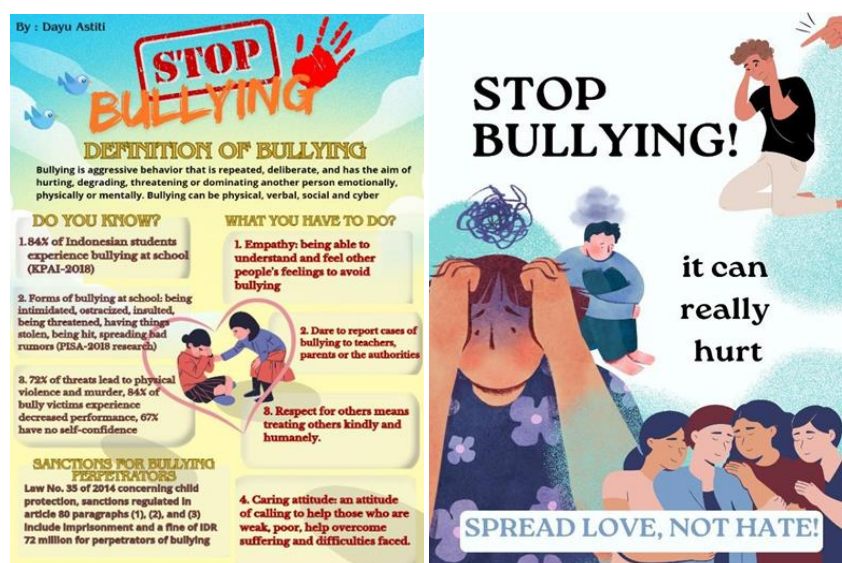
Gambar 4. Hasil Kerja Peserta Berupa Poster

Seperti yang disebutkan dalam silabus pelatihan di atas, di ujung pelatihan, setiap peserta diharapkan menciptakan media kampanye gerakan berbahasa dengan fokus spesifik bebas selama berkaitan dengan isu kampanye bijak berbahasa