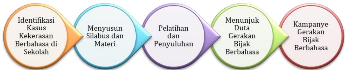
Gambar 1. Tahapan Pelaksanaan PKM

Dalam desain pengabdian kepada masyarakat ini, terdapat lima tahapan pelaksanaan PKM yang dirancang untuk menyikapi isu kekerasan dan pelecehan seksual di lingkungan pendidikan, khususnya yang terkait dengan penggunaan bahasa. Tahapan-tahapan ini disusun untuk mencapai tujuan pencegahan dan penanganan kekerasan berbahasa di lingkungan satuan pendidikan, sebagaimana dirangkum pada Gambar 1.