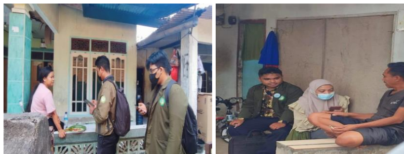
Gambar 2. Dokumentasi pengumpulan data oleh mahasiswa

Hasil analisis univariat menunjukkan bahwa dari 105 responden yang merespon dilaporkan bahwa mayoritas pengetahuan tentang bahaya narkoba adalah sedang (49,50%), sikap positif (81,00%), dan perilaku sedang (59,85%) tentang pencegahan narkoba. Berdasarkan data ini diketahui bahwa responden sebagian besar melaporkan tidak adanya keberadaan organisasi yang membantu warga terkait bahaya dan pencegahan narkoba di level keluarga, desa, dan bahkan puskesmas. Proses pengumpulan data dalam kegiatan pengabdian kepada masyarakat dilakukan secara langsung di lapangan dengan melibatkan mahasiswa sebagai enumerator. Dokumentasi kegiatan pengumpulan data tersebut disajikan pada Gambar 2. Gambar ini menunjukkan kegiatan pengumpulan data yang dilakukan oleh mahasiswa kepada masyarakat Dusun Melase melalui wawancara dan pengisian kuesioner. Kegiatan ini dilaksanakan secara langsung di lingkungan tempat tinggal warga dengan pendekatan komunikatif dan persuasif, sehingga responden dapat memberikan informasi secara terbuka. Proses pengumpulan data ini bertujuan untuk memperoleh gambaran awal mengenai tingkat pemahaman masyarakat terhadap bahaya narkoba serta kesiapan sarana dan peran masyarakat dalam upaya pencegahan penyalahgunaan narkoba di wilayah pariwisata.