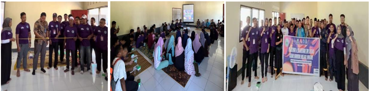
Gambar 3. Dokumentasi pelatihan dan pelantikan tim SATGAS MACAN

Kegiatan pengabdian ini dilanjutkan dengan pelaksanaan pelatihan serta pembentukan dan pelantikan satuan tugas masyarakat Sebagai bagian dari upaya pemberdayaan masyarakat dalam pencegahan penyalahgunaan narkoba, Gambar 3 menunjukkan rangkaian kegiatan pelatihan dan pelantikan tim Satuan Tugas Melase Cegah Narkoba (SATGAS MACAN) yang melibatkan masyarakat, tokoh lokal, serta mahasiswa. Kegiatan pelatihan difokuskan pada peningkatan pengetahuan mengenai bahaya narkoba, peran masyarakat dalam pencegahan, serta penguatan komitmen bersama untuk menciptakan lingkungan bebas narkoba di kawasan pariwisata. Pelantikan SATGAS MACAN menjadi simbol penguatan struktur lokal yang diharapkan mampu berperan aktif dan berkelanjutan sebagai garda terdepan dalam upaya pencegahan penyalahgunaan narkoba di Dusun Melase, Desa Batu Layar Barat.