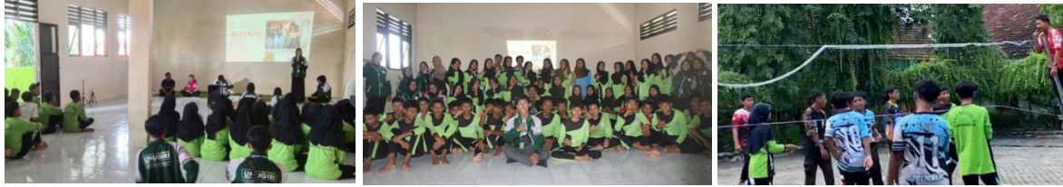
Gambar 2. Dokumentasi Kegiatan PkM

Tahap inti, yang mencakup pelaksanaan aktivitas olahraga berbasis kerja sama, simulasi konflik, serta pembekalan nilai-nilai anti- bullying melalui diskusi dan studi kasus. Tahap terakhir adalah post-kegiatan, di mana dilakukan post-test untuk mengukur peningkatan pemahaman peserta dan evaluasi akhir untuk menilai keberhasilan kegiatan serta memberikan umpan balik yang berguna untuk perbaikan di masa mendatang.