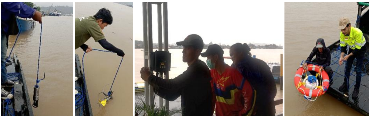
Gambar 2. Peserta sedang menurunkan alat ke perairan menggunakan tali pengaman

Pelaksanaan pengambilan data di Sungai Mahakam menghadirkan kompleksitas operasional yang menjadi ujian nyata bagi peserta. Secara ideal dalam pelaksanaan di lapangan, alat Valeport CTD dipasang dengan pelindung berupa kerangka besi untuk menjaga sensor terhadap potensi benturan saat di dalam air, sedangkan Valeport Current Meter dioperasikan dengan diikat pada dua kapal yang berjalan sejajar. Meskipun prosedur ideal belum sepenuhnya diterapkan dalam pelatihan ini, peserta tetap diarahkan untuk memahami cara pengoperasian alat serta teknik pengikatan tali pada instrumen secara mandiri (Gambar 1). Dalam skenario lapangan juga, instrumen dipasang pada dua lokasi berbeda, Valeport Tide Gauge dapat dipasang di dermaga untuk memantau fluktuasi pasang surut, sementara ADCP Teledyne dioperasikan dari kapal yang mengikuti rute survei yang telah ditentukan (Gambar 2). Menurut Gordon (2005) , pendekatan multipoint seperti ini ideal untuk memahami dinamika hidrografi di estuaria tropis. Namun pada hari pelaksanaan terjadi hujan dengan intensitas lebat menyebabkan penundaan operasional hingga 2 jam. Meskipun demikian, tim berhasil mengoptimalkan waktu saat intensitas hujan berkurang untuk menyelesaikan rencana pengambilan data.