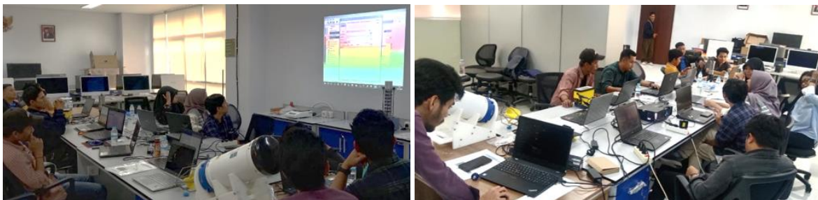
Gambar 4. Analisis data lapangan menggunakan software visualisasi; dan Pengolahan dan verifikasi berkelompok data hasil akuisisi lapangan.

Tahap pengolahan data menjadi komponen kritis dalam pelatihan ini, dimana peserta diajarkan teknik-teknik untuk memastikan kualitas data. Algoritma filtering adaptif yang dikembangkan oleh Sprintall et al., (2009) digunakan untuk mengurangi dampak noise dari aktivitas kapal. Data hasil pengukuran kemudian divalidasi dengan data historis BMKG dan hasil pengamatan satelit terkini. Proses validasi ini menjadi bagian integral dari pelatihan, memberikan peserta pemahaman komprehensif tentang penanganan data lapangan yang terkontaminasi gangguan lingkungan. Menurut Gordon, (2005) , proses validasi silang seperti ini sangat penting untuk memastikan akurasi data oseanografi, khususnya di wilayah dengan dinamika kompleks seperti estuaria ( La Fond, 1951 ).