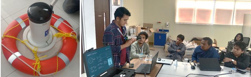
Gambar 1. Instalasi sistem pengamanan ADCP pada pelampung dan Aktivitas peserta saat melakukan kalibrasi CTD di laboratorium.

sedimen. Peserta kemudian melakukan latihan menyeluruh mulai dari pengecekan baterai, penyambungan kabel, hingga inialisasi sistem pada pelampung (Gambar 1). Proses ini mengikuti protokol standar IWG-OCM (2023) , dengan modifikasi khusus untuk kondisi wilayah tropis, termasuk penanganan kelembaban tinggi dan fluktuasi tempertur yang ekstrem yang mungkin akan ditemui saat pengambilan data di lapangan.