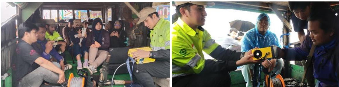
Gambar 3. Peserta pelatihan memperhatikan demonstrasi instruktur secara seksama mengenai mekanisme pengumpulan data di atas kapal.

Pelatihan lapangan dalam kondisi nyata ini memberikan dampak signifikan terhadap pengembangan kompetensi teknis peserta (Gambar 3). Evaluasi pasca pelatihan menunjukkan peningkatan dalam kemampuan troubleshooting peralatan. Peserta juga menunjukkan penguasaan yang lebih baik dalam: (1) penyesuaian parameter instrumen sesuai kondisi lapangan, (2) identifikasi anomali data, dan (3) penerapan teknik koreksi data dasar. Yang lebih penting, 85% peserta melaporkan peningkatan kepercayaan diri dalam menghadapi tantangan pengukuran lapangan yang kompleks dan mahal yaitu instrumen oseanografi fisika, sebagaimana setelah melakukan pelatihan langsung di lapangan.