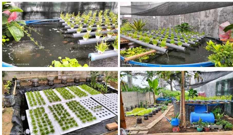
Gambar 7. Hasil Implementasi Akuaponik (Drip system, DWC dan NFT)

Hasil evaluasi menunjukkan keberhasilan pencapaian tujuan utama berupa terintegrasinya sistem pengelolaan kebun toga dan sayur dengan kolam ikan melalui penerapan tiga model Drip System , DWC dan NFT yang berfungsi secara terpadu (Gambar 7). Efektivitas penerapan tiga model akuaponik dibuktikan dengan melakukan evaluasi komparatif antara kondisi sebelum dan setelah kegiatan pengabdian, sebagaimana ditunjukkan ditunjukkan pada Tabel 1.