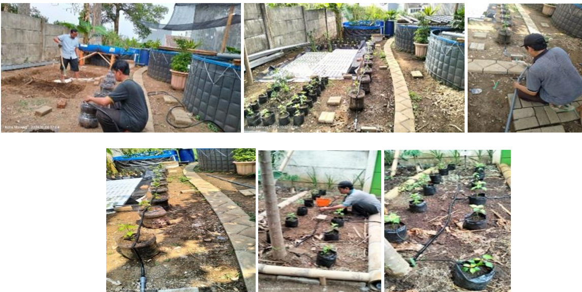
Gambar 4. Proses Instalasi Drip System

Sistem Deep Water Culture (DWC) yang diaplikasikan untuk budidaya tanaman kangkung menggunakan styrofoam sebagai rakit apung dan geomembran sebagai lapisan kedap air (Gambar 5). Hasil pengamatan menunjukkan bahwa kangkung dapat tumbuh optimal, ditandai dengan pertumbuhan daun yang lebat dan akar yang berkembang baik dalam larutan nutrisi. Keberadaan ikan Guppy ( Poecilia reticulata ) terbukti efektif mengendalikan populasi jentik nyamuk tanpa mengganggu kualitas air, sehingga sistem ini sekaligus berkontribusi dalam pencegahan penyakit yang berasal dari nyamuk. Penggunaan pompa sirkulasi dan aerator juga dilakukan untuk menjaga kadar oksigen terlarut tetap stabil, serta mendukung pertumbuhan tanaman dan kelangsungan hidup ikan.