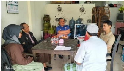
Gambar 1. Koordinasi awal dengan dengan Mitra

Pelaksanaan pengabdian diawali dengan observasi lapang dan koordinasi bersama mitra (pengurus RT 18 RW XI Kelurahan Merjosari Kota Malang) untuk memetakan kondisi eksisting (Gambar 1). Berdasarkan observasi pada kebun toga, sayur dan kolam ikan berkapasitas 3 m 3 (1 unit) dan koordinasi dengan mitra, ditemukan kendala pada pengelolaan kebun Toga dan sayur, serta kolam ikan, yaitu rendahnya hasil panen toga, sayur maupun ikan (50% bibit yang berhasil hidup/dipanen). Kolam ikan yang dioperasikan secara statis menyebabkan pemeliharaan ikan lele tidak optimal. Hal ini ditandai dengan kondisi air kolam yang sangat keruh, bau yang tidak sedap, terdapat buih tebal di permukaan air serta tingginya tingkat kematian ikan (50%). Penyebab kondisi kolam tersebut disebabkan karena pada kolam ikan tidak terdapat sistem filtrasi sehingga terjadi penumpukan amonia.