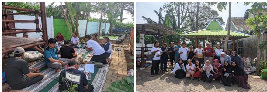
Gambar 8. Sosialisasi dan Serah Terima Hasil Pengabdian kepada Mitra

Pada akhir masa pengabdian, dilaksanakan kegiatan sosialisasi dan serah terima hasil pengabdian berupa Kolam Ikan Nila yang mengimplementasikan sistem akuaponik terpadu Drip System , DWC dan NFT , untuk tanaman Toga dan sayur kepada mitra (Gambar 8). Kegiatan ini dihadiri oleh Ketua dan sekretaris RW, ketua dan pengurus serta ibu-ibu PKK. Pada kegiatan ini juga disampaikan pentingnya implementasi sistem akuaponik terhadap pengelolaan kebun Toga dan sayur.