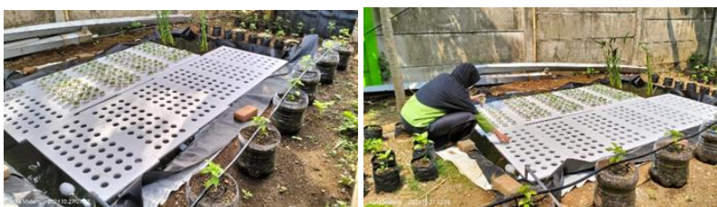
Gambar 5. Implementasi Deep Water Culture (DWC)

Sistem Deep Water Culture (DWC) yang diaplikasikan untuk budidaya tanaman kangkung menggunakan styrofoam sebagai rakit apung dan geomembran sebagai lapisan kedap air (Gambar 5). Hasil pengamatan menunjukkan bahwa kangkung dapat tumbuh optimal, ditandai dengan pertumbuhan daun yang lebat dan akar yang berkembang baik dalam larutan nutrisi. Keberadaan ikan Guppy ( Poecilia reticulata ) terbukti efektif mengendalikan populasi jentik nyamuk tanpa mengganggu kualitas air, sehingga sistem ini sekaligus berkontribusi dalam pencegahan penyakit yang berasal dari nyamuk. Penggunaan pompa sirkulasi dan aerator juga dilakukan untuk menjaga kadar oksigen terlarut tetap stabil, serta mendukung pertumbuhan tanaman dan kelangsungan hidup ikan.