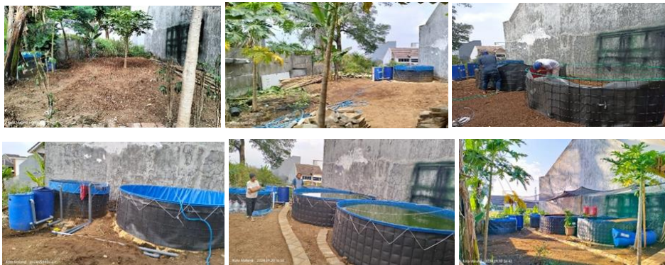
Gambar 2. Restrukturisasi tata letak dan peningkatan jumlah-kapasitas kolam ikan

Berbeda dengan pengelolaan tahun sebelumnya, pengelolaan kebun dan kolam ikan pada tahun ini dilakukan dengan menerapkan sistem sirkulasi tertutup ( closed-loop ). Langkah teknis awal yang dilakukan adalah restrukturisasi tata letak dan peningkatan jumlah dan kapasitas kolam ikan, yaitu dari 1 (satu) unit berkapasitas 3 m 3 menjadi 2 (dua) unit berkapasitas masing-masing 7 m 3 (Gambar 2.). Kolam lama berkapasitas 3 m 3 dialihfungsikan secara spesifik sebagai kolam filtrasi biologis (biofilter), sedangkan kolam ikan yang baru spesifik digunakan sebagai kolam utama budidaya ikan nila.