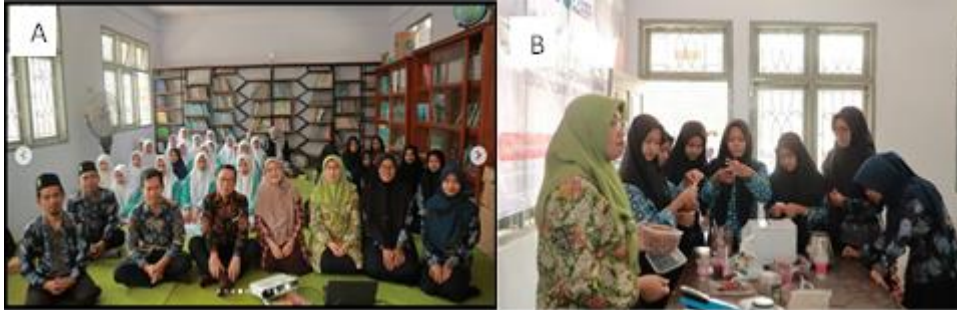
Gambar 2. Dokumentasi Kegiatan, A) Foto bersama tim pelaksana dan peserta; B) Praktik membuat teh kantong bunga.

Rangkaian kegiatan pengabdian masyarakat ini berjalan sukses sesuai perencanaan dengan melibatkan 30 siswa MTs dan MA NURIS Silo, serta didampingi oleh jajaran guru dan struktural madrasah. Pelaksanaan pengabdian dibagi menjadi dua sesi utama yang saling berkesinambungan: sesi transfer pengetahuan kognitif melalui workshop interaktif, yang kemudian divalidasi langsung melalui sesi praktikum produksi produk (Gambar 2).