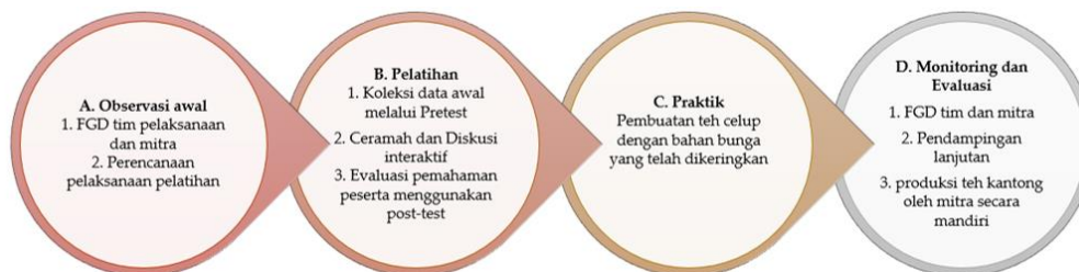
Gambar 1. Skema metode pelaksanaan pengabdian

Target kegiatan pengabdian yaitu siswa MTs dan MA Nuris Silo sejumlah 30 orang. Metode kegiatan dilaksanakan dengan pendekatan Capacity Building , bertujuan untuk meningkatkan pengetahuan, dan keterampilan individu atau kelompok dalam suatu komunitas sehingga berperan lebih aktif dan efektif dalam pengembangan diri sesuai dengan daya dukung yang dimiliki. Rangkaian langkah kegiatan yang telah dilaksanakan yaitu workshop/pelatihan yang dilanjutkan dengan praktik langsung. Selanjutnya adalah monitoring dan evaluasi keberlanjutan program. Secara skematis metode pelaksanaan pengabdian disajikan pada Gambar 1.