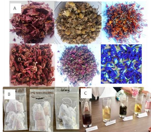
Gambar 3. Dokumentasi bahan dan hasil praktik teh kantong, A) bunga kering terdiri atas bunga sepatu, chamomile, marigold, rosella, mawar, dan telang; B) teh kantong; C) Teh Bunga

Kegiatan praktik berfokus pada produk olahan potensial berbasis bunga yaitu pembuatan teh kantong. Peserta sangat antusias berpartisipasi aktif dalam setiap tahapan kegiatan praktikum. Dengan alat dan bahan yang relatif mudah untuk disiapkan, teh kantong sangat memungkinkan untuk menjadi peluang usaha berkelanjutan bagi sekolah. Hal ini didukung oleh banyaknya kegiatan serupa untuk pemberdayaan masyarakat (Faridy et al. 2022). Enam bahan bunga kering, teh kantong hasil praktikum disajikan pada Gambar 3. Sebagai olahan pangan, maka penting untuk menjaga kualitas bahan. Oleh karenanya, dalam kegiatan praktikum ini, siswa diberikan informasi tentang proses pengeringan bunga dengan food dryer atau oven pada suhu 50°C selama 2 jam. Pengeringan dengan metode konvensional yaitu kering angin memiliki beberapa kekurangan antara lain waktu lama, kualitas produk menjadi tidak konsisten (perubahan warna, kehilangan aroma, dan memungkinkan penurunan kadar nutrisi), serta adanya resiko kontaminasi.