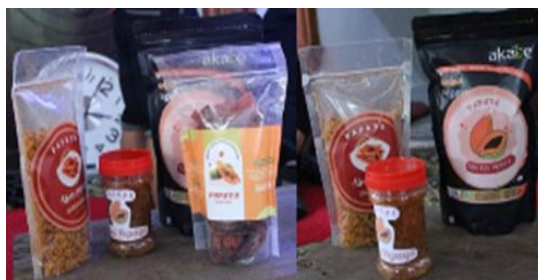
Gambar 3. Produk hasil pengelolaan budidaya Carica papaya L.

Monitoring dan evaluasi program secara keseluruhan bertujuan untuk melihat sejauh mana program ini memberikan manfaat nyata bagi pemberdayaan Kelompok Petani Hutan Petak 56 di Desa Sumberjati, Kecamatan Silo, Kabupaten Jember. Dengan demikian, upaya peningkatan kapasitas dan kesejahteraan petani hutan dapat berjalan secara berkelanjutan serta selaras dengan tujuan pembangunan kehutanan partisipatif di tingkat lokal.