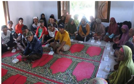
Gambar 2. Kegiatan workshop (pemaparan materi)

Kegiatan simulasi (praktik langsung) menjadi titik berat pelatihan, di mana peserta secara aktif terlibat dalam mengolah pepaya menjadi manisan pepaya, sirup, kripik, selai, dan saus (Gambar 2). Proses ini tidak hanya melatih keterampilan teknis, tetapi juga mengajarkan prinsip sanitasi, pengemasan higienis, serta penghitungan biaya produksi agar produk memiliki daya saing. Peserta bahkan diberi kesempatan untuk mencoba langsung menjual produk hasil praktek melalui platform online, sehingga mereka memahami alur transaksi digital secara nyata. Pelatihan ini dirancang berkelanjutan, dengan rencana pendampingan lanjutan berupa monitoring hasil penjualan.