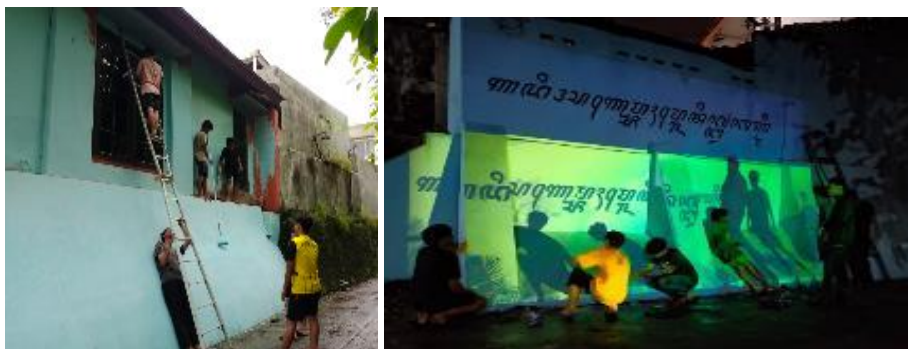
Gambar 4. Pelaksanaan Persiapan Lahan dan Pengecatan

Berdasarkan pencatatan kehadiran dan observasi partisipatif, tingkat keterlibatan warga pada kegiatan FGD mencapai sekitar \pm 80\% dari peserta yang diundang, yang menunjukkan keberhasilan pendekatan partisipatif dalam membangun legitimasi sosial terhadap desain mural. Hasil kesepakatan desain dari FGD ini selanjutnya menjadi acuan bagi tahap koordinasi teknis dengan mitra, persiapan media dan lokasi mural, serta produksi mural secara kolaboratif, sehingga proses pelaksanaan berjalan terencana dengan dukungan material dan kesiapan teknis yang memadai. Pendekatan ini sejalan dengan prinsip participatory design dan participatory action research yang menempatkan dialog kolektif sebagai fondasi utama dalam menghasilkan intervensi ruang publik yang kontekstual, berkelanjutan, dan berbasis komunitas (Sanoff, 2000; Wilkie, 2018; Kindon et al., 2007; Mohamed & Ali, 2022).