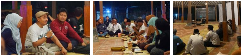
Gambar 3. Pelaksanaan FGD Penjaringan Ide Mural

Forum diskusi kelompok (FGD) penjaringan ide mural merupakan bagian dari tahap pelaksanaan program muralisasi partisipatif di Desa Wisata Green Kayen yang dilaksanakan setelah tahap persiapan, sebagai mekanisme utama dalam perumusan konsep visual mural (Gambar 3). Kegiatan ini berfungsi sebagai ruang deliberatif untuk menerjemahkan narasi, identitas, dan aspirasi lokal ke dalam desain mural yang disepakati secara kolektif. FGD melibatkan dosen dan mahasiswa sebagai fasilitator desain, serta partisipasi aktif warga masyarakat yang terdiri atas tokoh masyarakat, Karang Taruna, PKK, dan pengelola Pokdarwis sebagai representasi komunitas lokal.