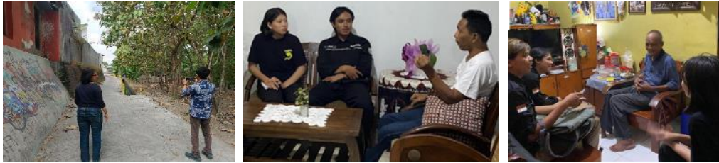
Gambar 2. Pelaksanaan Survey Lokasi dan Wawancara Tokoh Masyarakat Setempat

dilakukan untuk menggali narasi, nilai budaya, dan simbol lokal yang relevan sebagai landasan konseptual perumusan tema dan konten visual mural. Tahapan persiapan ini menghasilkan narasi lokal dan tema visual yang merepresentasikan identitas serta aspirasi masyarakat setempat, sekaligus memastikan bahwa intervensi mural dibangun atas dasar legitimasi sosial dan kesesuaian konteks ruang. Pendekatan ini sejalan dengan prinsip participatory design dan participatory action research yang menekankan keterlibatan masyarakat sejak tahap awal sebagai faktor penting dalam meningkatkan keberterimaan dan keberlanjutan intervensi ruang publik (Sanoff, 2000; Kindon et al., 2007; Wilkie, 2018).