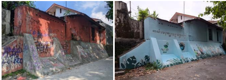
Gambar 5. Dokumentasi hasil Mural sebelum dan setelah program

Pelaksanaan persiapan lahan dan pengecatan mural merupakan bagian dari tahap pelaksanaan program muralisasi partisipatif di Desa Wisata Green Kayen yang dilakukan setelah perumusan konsep visual melalui FGD (Gambar 4). Tahapan ini mencakup pembersihan dan penyiapan bidang dinding sebagai prasyarat kualitas visual, diikuti dengan proses pengecatan mural secara kolaboratif dalam rentang waktu Oktober hingga Desember 2024. Kegiatan ini melibatkan dosen dan mahasiswa sebagai fasilitator teknis, pemuda Karang Taruna, serta partisipasi aktif warga masyarakat sekitar lokasi mural. Proses pengecatan dilakukan melalui transfer desain dan pengerjaan manual, sehingga mural yang dihasilkan tidak hanya berfungsi sebagai luaran visual, tetapi juga sebagai hasil kolaborasi sosial yang membangun ruang interaksi dan ekspresi kolektif masyarakat. Temuan ini sejalan dengan prinsip participatory design yang menempatkan produksi bersama sebagai sarana penguatan rasa memiliki terhadap ruang publik dan keberlanjutan intervensi berbasis komunitas (Sanoff, 2000; Wilkie, 2018).