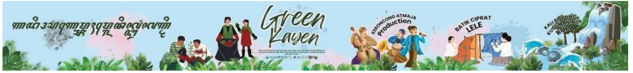
Gambar 6. Desain Mural yang disepakati