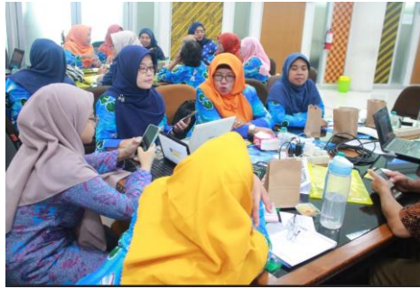
Gambar 4. Diskusi Kelompok Menyusun Modul Ajar dengan Model Inkuiri Terbimbing

Gambar 4 menunjukkan kegiatan diskusi kelompok untuk menyusun modul ajar dengan model inkuiri terbimbing. Kegiatan ini bertujuan memastikan bahwa peserta pelatihan dapat menerapkan materi yang disampaikan dalam penyusunan modul ajar pada materi dan kelas mereka sendiri. Hal ini dilakukan karena penyusunan perangkat pembelajaran termasuk salah satu permasalahan dan kendala utama yang dialami guru dalam menerapkan model inkuiri terbimbing. Hal ini sejalan dengan hasil penelitian Yuliani et al. (2017) menyatakan bahwa terdapat beberapa temuan terkait kesulitan guru dalam menerapkan model pembelajaran inkuiri terbimbing yaitu: (1) guru belum memahami mengenai perangkat pembelajaran berbasis model inkuiri terbimbing; (2) guru tidak mengembangkan perangkat pembelajaran berbasis model inkuiri terbimbing di sekolah; (3) guru tidak menerapkan model pembelajaran inkuiri terbimbing di sekolah; serta (4) guru tidak memiliki keterampilan dalam pelaksanaan model pembelajaran inkuiri terbimbing.