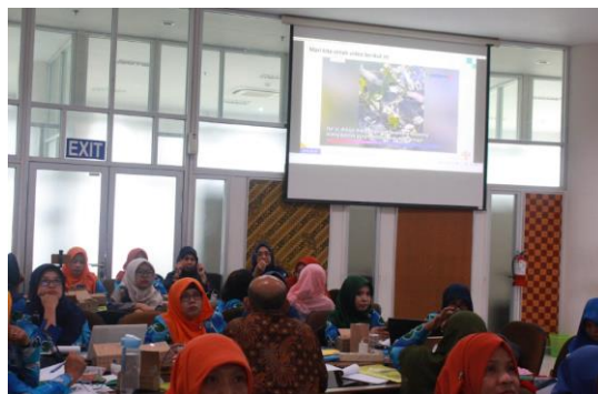
Gambar 3. Praktik Pemodelan Pembelajaran dengan Model Inkuiri Terbimbing pada Materi “Keseimbangan Lingkungan”

Setelah pemaparan materi tentang konsep model pembelajaran inkuiri terbimbing kegiatan dilanjutkan dengan praktik pemodelan pembelajaran Biologi dengan model inkuiri terbimbing pada materi “Keseimbangan Lingkungan” (Gambar 3). Kegiatan pemodelan dipraktikkan oleh pemateri dengan peserta pengabdian sebagai peserta didiknya. Pemodelan bertujuan untuk memberikan gambaran kepada peserta pelatihan tentang sintaks model pembelajaran inkuiri terbimbing beserta penerapannya di kelas. Sintaks model pembelajaran inkuiri terbimbing menurut Andarie (2023) terdapat enam langkah yaitu: (1) menampilkan masalah, (2) membuat hipotesis, (3) merancang percobaan, (4) melakukan percobaan, (5) menganalisis data, serta (6) membuat kesimpulan. Melalui penerapan model pembelajaran inkuiri terbimbing dengan langkah-langkah tersebut, maka siswa dapat terlibat aktif di dalam proses menemukan konsep pembelajaran. Hal ini menurut Khasanah et al. (2016) dapat meningkatkan keterampilan proses sains dan sikap ilmiah siswa. Melalui proses menemukan, retensi materi pembelajaran yang diperoleh siswa diharapkan akan lebih tinggi sehingga juga akan berpengaruh terhadap hasil belajar.