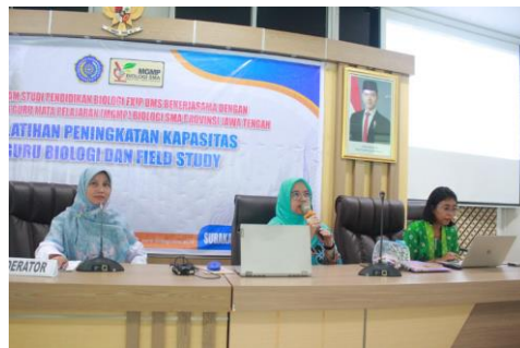
Gambar 5. Presentasi Perwakilan Kelompok

Gambar 4 menunjukkan kegiatan diskusi kelompok untuk menyusun modul ajar dengan model inkuiri terbimbing. Kegiatan ini bertujuan memastikan bahwa peserta pelatihan dapat menerapkan materi yang disampaikan dalam penyusunan modul ajar pada materi dan kelas mereka sendiri. Hal ini dilakukan karena penyusunan perangkat pembelajaran termasuk salah satu permasalahan dan kendala utama yang dialami guru dalam menerapkan model inkuiri terbimbing. Hal ini sejalan dengan hasil penelitian Yuliani et al. (2017) menyatakan bahwa terdapat beberapa temuan terkait kesulitan guru dalam menerapkan model pembelajaran inkuiri terbimbing yaitu: (1) guru belum memahami mengenai perangkat pembelajaran berbasis model inkuiri terbimbing; (2) guru tidak mengembangkan perangkat pembelajaran berbasis model inkuiri terbimbing di sekolah; (3) guru tidak menerapkan model pembelajaran inkuiri terbimbing di sekolah; serta (4) guru tidak memiliki keterampilan dalam pelaksanaan model pembelajaran inkuiri terbimbing.