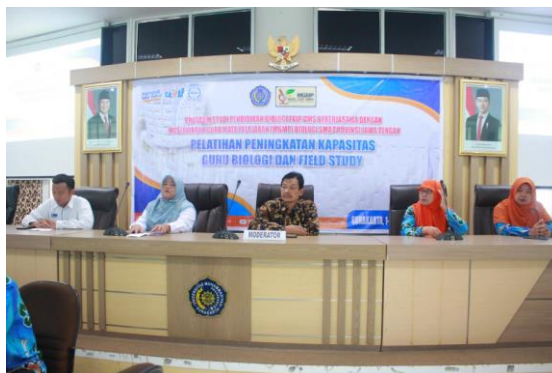
Gambar 1. Pembukaan Kegiatan Oleh Ketua Panitia, Ketua Program Studi Pendidikan Biologi FKIP UMS, Ketua MKKS Kota Surakarta, Ketua Panitia dari MGMP Biologi, dan Ketua MGMP Biologi Provinsi Jawa Tengah

Kegiatan dilaksanakan dalam dua tahap yaitu kegiatan secara luring dan daring. Kegiatan secara luring dilaksanakan pada hari Sabtu, 2 November 2024 di ruang seminar gedung induk Siti Walidah Universitas Muhammadiyah Surakarta. Kegiatan diawali dengan pembukaan, menyanyikan lagu Indonesia Raya dan Mars Sang Surya, sambutan dari ketua MKKS Kota Surakarta, serta sambutan dan pembukaan kegiatan oleh Ketua Program Studi Pendidikan Biologi. Pada kegiatan pembukaan juga dilakukan pretest untuk mengetahui pengetahuan awal guru tentang materi pengabdian kepada masyarakat.