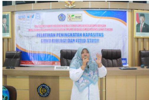
Gambar 2. Pemaparan Materi tentang Konsep Model Pembelajaran Inkuiri Terbimbing

Kegiatan dilanjutkan dengan pemaparan materi tentang konsep pembelajaran dengan model inkuiri terbimbing (Gambar 2). Pada sesi ini disampaikan materi tentang karakteristik dan sintaks model inkuiri terbimbing. Karakteristik utama model pembelajaran inkuiri terbimbing adalah peserta didik diberikan pertanyaan yang bersifat membimbing sesuai dengan tingkatan kesulitan yang diinginkan sampai peserta didik dapat menyelesaikan masalah secara mandiri. Penggunaan model inkuiri terbimbing mampu mengatasi masalah karena menekankan pada pencarian dan pemecahan masalah sehari-hari di lingkungan peserta didik (Cahaya et al., 2023). Model pembelajaran guided inquiry menurut Puspitasari et al. (2019) membutuhkan perencanaan yang disusun bersama antara guru dan siswa yang berbentuk pertanyaan yang mengarahkan siswa kepada penyelesaian permasalahan yang akan dipecahkan. Aktivitas siswa difokuskan pada diskusi dan berbagi pendapat yang dipandu oleh pertanyaan-pertanyaan pemandu yang diberikan oleh guru.