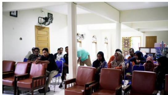
Gambar 2. Peserta kegiatan pengabdian

Para peserta kegiatan pengabdian yang terdiri dari tokoh masyarakat, pemuda dan perwakilan organisasi lokal. Tingginya antusiasme peserta menunjukkan adanya kebutuhan dan minat besar terhadap peningkatan literasi informasi publik di nagari.