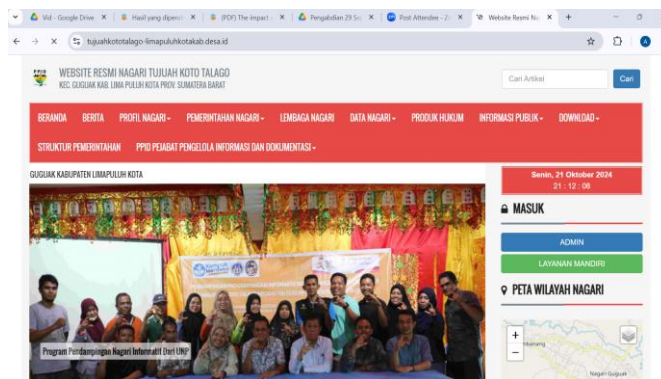
Gambar 4. Website Nagari VII Koto Talago

Sosialisasi pengelolaan web informasi nagari oleh narasumber dapat dilihat pada Gambar 3. Pada sesi ini, peserta diberikan pengetahuan untuk memahami struktur informasi, mengunggah konten, serta mengelola menu pelayanan informasi publik. Sosialisasi dan pelatihan ini bertujuan memperkuat kapasitas teknis perangkat nagari dan masyarakat dalam memanfaatkan Teknologi sebagai sarana transparansi. Terdapat peningkatan pengetahuan dan keterampilan dalam penggunaan website. Peserta merasa lebih percaya diri dalam menyampaikan aspirasi mereka kepada pemerintah.