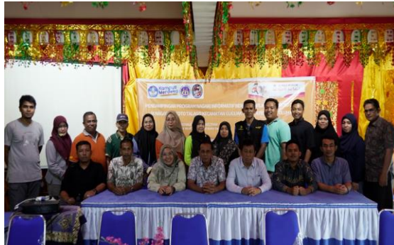
Gambar 1. Pembukaan Kegiatan oleh ketua Pengabdian dan wali nagari

Pelaksanaan pendampingan nagari melalui sosialisasi yang dibuka oleh ketua pengabdian bersama Wali Nagari VII Koto Talago. Pembukaan ini menandai komitmen bersama antara tim pelaksana dan pemerintah nagari dalam mendorong transparansi informasi publik serta meningkatkan partisipasi masyarakat yang disajikan pada gambar 1.