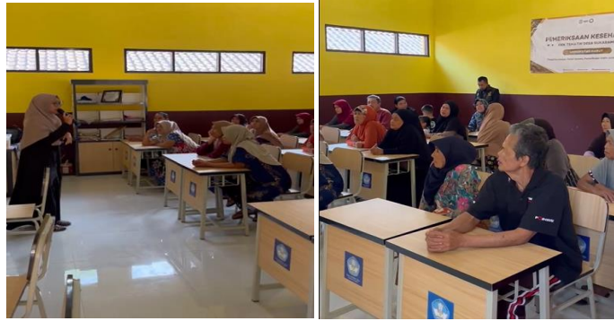
Gambar 3. Edukasi Pola Hidup Sehat kepada Lansia di Kampung Legok, Desa Sukarame

Selain edukasi, para lansia juga mendapatkan layanan pemeriksaan kesehatan dasar yang meliputi pemeriksaan kadar gula darah, tekanan darah, asam urat, serta kolesterol. Pemeriksaan ini bertujuan untuk mengetahui kondisi kesehatan masing-masing peserta, sekaligus memberikan gambaran awal mengenai faktor risiko yang perlu diwaspadai. Pemeriksaan kesehatan rutin dikaitkan dengan penurunan risiko kematian akibat penyakit kardiovaskular dan kematian total pada populasi lansia dengan hipertensi. Hal ini mendukung bahwa pemeriksaan kesehatan dasar dapat memberikan manfaat nyata khususnya bagi kelompok usia lanjut (Li et al., 2024). Hasil pemeriksaan kemudian dijelaskan secara sederhana agar para lansia lebih memahami kondisi kesehatannya dan termotivasi untuk melakukan upaya pencegahan maupun pengelolaan penyakit secara tepat. Para lansia antusias mengikuti pemeriksaan kesehatan tersebut, hal ini ditunjukkan pada Gambar 4. Sebagai bentuk apresiasi, tim pengabdian juga memberikan bingkisan kepada 10 peserta lansia pertama yang mendaftarkan diri. Pemberian bingkisan ini diharapkan dapat menjadi motivasi bagi para lansia untuk lebih aktif mengikuti kegiatan kesehatan, serta menumbuhkan semangat dalam menjaga pola hidup sehat secara berkelanjutan.