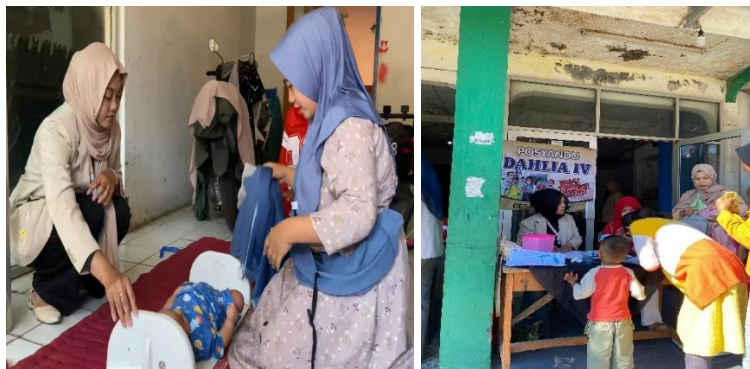
Gambar 2. Pendampingan Pemeriksaan Kesehatan Ibu Hamil dan Anak-anak

Selain itu, tim pengabdian juga memberikan pemahaman tentang pentingnya pemeriksaan kesehatan ibu hamil dan anak-anak. Pendampingan juga dilakukan pada saat pemeriksaan kesehatan di Posyandu (Gambar 2). Melalui kegiatan ini, diharapkan ibu hamil dan orang tua balita lebih memahami pentingnya pemeriksaan rutin dan peran aktif keluarga dalam menjaga kesehatan serta mencegah terjadinya stunting pada anak. Pengetahuan merupakan salah satu indikator penting dalam menentukan tindakan seseorang. Ibu hamil dengan pemahaman yang baik tentang pentingnya pemeriksaan rutin akan lebih termotivasi untuk melaksanakannya secara teratur (Bahrun, 2024). Pernyataan ini sejalan dengan temuan (Susanti et al., 2020), yang menunjukkan bahwa mayoritas responden (60%), memiliki tingkat pengetahuan baik dan melakukan pemeriksaan kehamilan rutin.