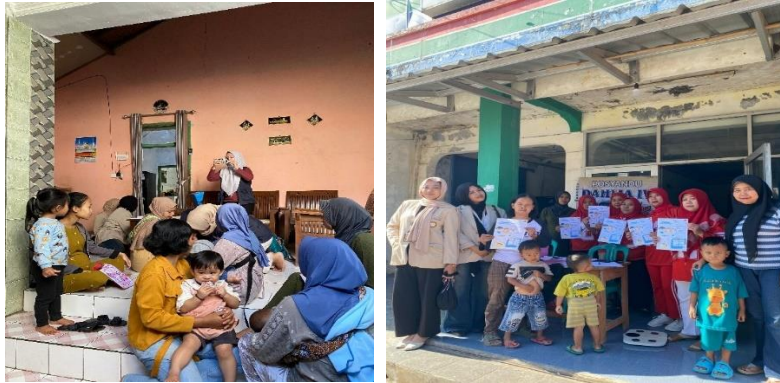
Gambar 1. Edukasi Pencegahan Stunting di Posyandu Dahlia IV

Selain itu, tim pengabdian juga memberikan pemahaman tentang pentingnya pemeriksaan kesehatan ibu hamil dan anak-anak. Pendampingan juga dilakukan pada saat pemeriksaan kesehatan di Posyandu (Gambar 2). Melalui kegiatan ini, diharapkan ibu hamil dan orang tua balita lebih memahami pentingnya pemeriksaan rutin dan peran aktif keluarga dalam menjaga kesehatan serta mencegah terjadinya stunting pada anak. Pengetahuan merupakan salah satu indikator penting dalam menentukan tindakan seseorang. Ibu hamil dengan pemahaman yang baik tentang pentingnya pemeriksaan rutin akan lebih termotivasi untuk melaksanakannya secara teratur (Bahrun, 2024). Pernyataan ini sejalan dengan temuan (Susanti et al., 2020), yang menunjukkan bahwa mayoritas responden (60%), memiliki tingkat pengetahuan baik dan melakukan pemeriksaan kehamilan rutin.