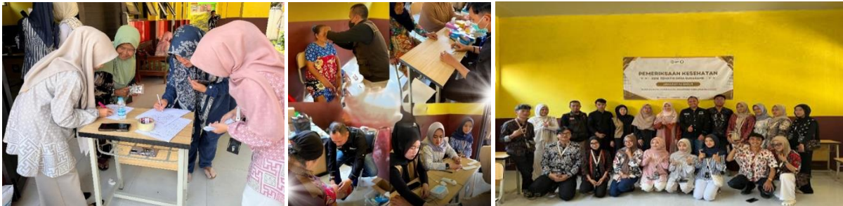
Gambar 4. Pemeriksaan Kesehatan terhadap Lansia oleh Tim Pengabdian bersama Relawan dari Perkumpulan Pemuda Peduli Kesehatan Jawa Barat

Selain edukasi, para lansia juga mendapatkan layanan pemeriksaan kesehatan dasar yang meliputi pemeriksaan kadar gula darah, tekanan darah, asam urat, serta kolesterol. Pemeriksaan ini bertujuan untuk mengetahui kondisi kesehatan masing-masing peserta, sekaligus memberikan gambaran awal mengenai faktor risiko yang perlu diwaspadai. Pemeriksaan kesehatan rutin dikaitkan dengan penurunan risiko kematian akibat penyakit kardiovaskular dan kematian total pada populasi lansia dengan hipertensi. Hal ini mendukung bahwa pemeriksaan kesehatan dasar dapat memberikan manfaat nyata khususnya bagi kelompok usia lanjut (Li et al., 2024). Hasil pemeriksaan kemudian dijelaskan secara sederhana agar para lansia lebih memahami kondisi kesehatannya dan termotivasi untuk melakukan upaya pencegahan maupun pengelolaan penyakit secara tepat. Para lansia antusias mengikuti pemeriksaan kesehatan tersebut, hal ini ditunjukkan pada Gambar 4. Sebagai bentuk apresiasi, tim pengabdian juga memberikan bingkisan kepada 10 peserta lansia pertama yang mendaftarkan diri. Pemberian bingkisan ini diharapkan dapat menjadi motivasi bagi para lansia untuk lebih aktif mengikuti kegiatan kesehatan, serta menumbuhkan semangat dalam menjaga pola hidup sehat secara berkelanjutan.