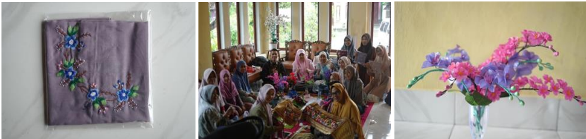
Gambar 5. Dokumentasi Refresh Training Minggu 14 September 2025

Kegiatan ini memperdalam keterampilan sekaligus mengajarkan standar kualitas produk. Peserta dilatih teknik fotografi sederhana untuk membuat katalog digital maupun cetak. Selain itu, mereka dikenalkan strategi pemasaran online melalui media sosial dan marketplace. Pada sesi ini, dikumpulkan pula hasil karya yang dikerjakan di rumah, berupa jilbab sulam, taplak rajut, bunga plastik, hingga tas dan dompet rajut. Hasil karya tersebut menjadi bukti kesiapan masyarakat dalam menghasilkan produk layak jual.