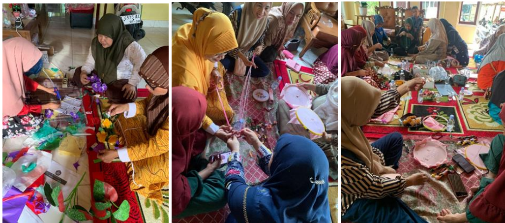
Gambar 4. Dokumentasi Pelatihan Sabtu-Minggu 23-24 Agustus 2025

Peserta menerima alat dan bahan dasar untuk memudahkan praktik langsung. Hari pertama fokus pada keterampilan rajut, menghasilkan produk bernilai jual seperti tas, dompet, jilbab rajut, dan aksesoris. Hari kedua mengembangkan variasi sulaman dan bunga plastik daur ulang, sebagai bentuk inovasi ramah lingkungan. Hasil pelatihan menunjukkan peningkatan keterampilan sekaligus kreativitas peserta dalam memodifikasi produk.