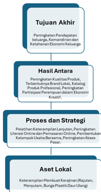
Gambar 2. Pohon Harapan Bersama (Dream)

Setelah aset masyarakat berhasil diidentifikasi, tahapan selanjutnya adalah merumuskan visi dan strategi program secara partisipatif (Ramadhan et al., 2025). Proses ini diwujudkan melalui pembuatan pohon harapan, sebuah metode visual yang merepresentasikan cita-cita kolektif masyarakat terhadap pengembangan UMKM kerajinan rajutan tangan. Pohon harapan ini tidak sekadar menggambarkan tujuan akhir, melainkan juga memetakan secara sistematis langkah-langkah strategis yang diperlukan untuk mencapainya. Penyusunan pohon harapan dilakukan melalui diskusi bersama para ibu PKK, dan perangkat nagari. Diskusi ini bertujuan untuk menggali harapan serta aspirasi mereka mengenai masa depan UMKM rajutan dan kerajinan bunga plastik daur ulang di Nagari Campago. Hasil dari diskusi tersebut menunjukkan bahwa pengembangan UMKM diharapkan dapat mendukung aktivitas ekonomi rumah tangga dan penguatan kapasitas keluarga melalui keterlibatan perempuan dalam usaha produktif.