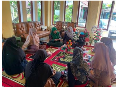
Gambar 3. Dokumentasi FGD

FGD menjadi ruang untuk memvalidasi hasil pemetaan aset dan menggali aspirasi warga. Peserta terdiri dari ibu PKK, pengrajin, tokoh masyarakat, serta perangkat nagari. Melalui metode appreciative inquiry, warga mengidentifikasi kekuatan dan pengalaman keberhasilan sebelumnya. Forum ini menghasilkan kesepakatan jenis pelatihan yang dibutuhkan, strategi pemasaran digital, serta gagasan pembentukan kelompok usaha.