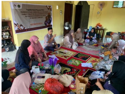
Gambar 6. Pelatihan Pengelolaan Keuangan UMKM dan Literasi Digital Lanjutan 26 September 2025

Materi berfokus pada pencatatan keuangan, perhitungan biaya produksi, dan strategi harga jual. Narasumber dari Dewan Koperasi Indonesia menekankan pentingnya pembentukan koperasi untuk memperkuat posisi tawar, mempermudah akses permodalan, dan menjamin keberlanjutan usaha. Pada sesi ini juga dilakukan kurasi produk unggulan yang dipersiapkan untuk pameran UMKM tingkat internasional.