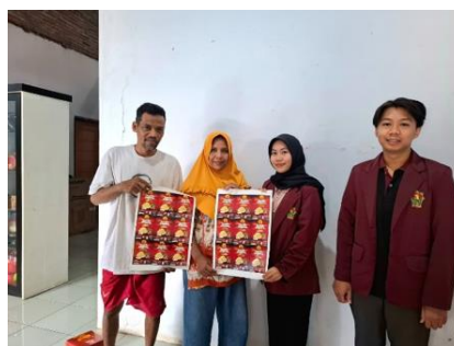
Gambar 5. Penyerahan Desain Logo dan Label Kemasan

Selanjutnya, dilakukan penyerahan hasil kepada pemilik UMKM yang dilanjutkan dengan kegiatan sosialisasi mengenai pentingnya branding dalam pemasaran produk. Sosialisasi ini mencakup pemahaman fungsi logo, kemasan, serta pentingnya konsistensi identitas merek dalam strategi pemasaran. Kegiatan berlangsung secara interaktif melalui diskusi dan tanya jawab, sehingga terjadi proses transfer pengetahuan yang lebih efektif. Melalui kegiatan ini, pelaku UMKM mulai memahami bahwa kemasan tidak hanya berfungsi sebagai pelindung produk, tetapi juga sebagai media komunikasi visual yang memengaruhi persepsi konsumen terhadap kualitas produk.