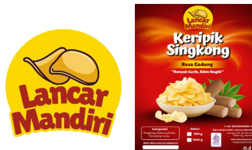
Gambar 4. Logo dan Label Kemasan Baru Setelah Pendampingan

Proses implementasi dilakukan secara bertahap mulai dari, pembuatan sketsa awal, digitalisasi, hingga finalisasi kemasan untuk beberapa ukuran produk. Perubahan utama terlihat pada peningkatan struktur visual kemasan yang lebih rapi, penggunaan warna yang lebih konsisten, serta penambahan informasi produk secara lengkap. Transformasi ini menunjukkan adanya penguatan identitas merek yang lebih terarah dan profesional dibandingkan kondisi sebelumnya.