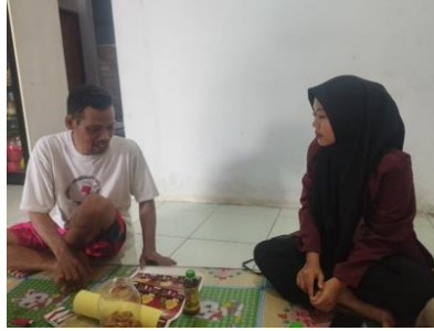
Gambar 6. Sosialisasi bersama pemilik UMKM Lancar Mandiri

Pada tahap evaluasi, kegiatan dilakukan untuk mengetahui tingkat pemahaman dan respons pelaku usaha setelah pendampingan. Evaluasi dilakukan melalui wawancara dengan beberapa pertanyaan terkait pemahaman branding, khususnya fungsi logo dan kemasan. Dari 15 pertanyaan yang diberikan pemilik UMKM mampu menjawab 12 pertanyaan dengan benar. Hasil evaluasi menunjukkan adanya peningkatan pemahaman pelaku usaha terhadap pentingnya branding sebagai strategi pemasaran dan identitas produk.