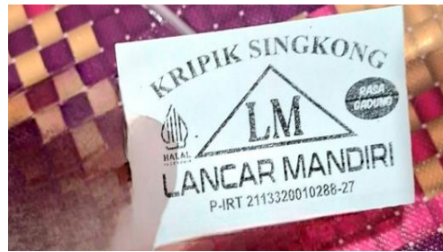
Gambar 3. Logo dan Label kemasan lama sebelum pendampingan desain.

Berdasarkan temuan tersebut, dilakukan intervensi berupa pendampingan desain identitas visual melalui pengembangan logo dan kemasan baru. Proses ini dilakukan secara partisipatif dengan melibatkan pemilik usaha dalam pemilihan warna, bentuk visual, informasi produk, dan slogan yang digunakan pada kemasan. Pendekatan partisipatif ini penting karena dalam konteks pemberdayaan, pelaku usaha tidak hanya menjadi penerima manfaat, tetapi juga aktor aktif dalam proses perubahan. Hasil dari tahap ini berupa tersusunnya konsep desain logo dan kemasan baru yang lebih modern, informatif, dan sesuai dengan karakter produk.