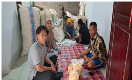
Gambar 2. Kegiatan Observasi dan Diskusi Bersama Pemilik UMKM Keripik Singkong Lancar Mandiri.

Kegiatan pengabdian masyarakat ini dilaksanakan di UMKM Keripik Singkong Lancar Mandiri yang berlokasi di Desa Dongos, Kecamatan Kedung, Kabupaten Jepara pada Bulan Oktober 2025. Berdasarkan hasil wawancara dan observasi, diketahui bahwa usaha ini telah memiliki pelanggan tetap hingga luar daerah, seperti Jakarta. Namun, ditemukan beberapa permasalahan pada aspek identitas visual produk. Logo yang digunakan sebelumnya masih sederhana dan belum mencerminkan identitas merek yang kuat. Selain itu, label kemasan belum terintegrasi secara permanen dan belum memuat informasi produk secara lengkap seperti komposisi, berat bersih, tanggal kedaluwarsa, nomor P-IRT, dan sertifikasi halal. Kondisi ini berdampak pada rendahnya daya tarik visual dan belum optimalnya kepercayaan konsumen terhadap produk.