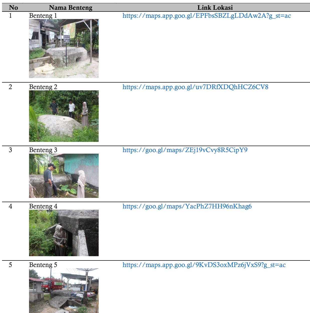
Tabel 1. Sebaran Benteng Jepang dan Bunker

Jepang dan Menampung Aspirasi Masyarakat. Pada tahap ini, Tim Pengabdian tidak hanya berfokus pada eksplorasi fisik situs Benteng Jepang, tetapi juga melakukan pengumpulan data sosial dari masyarakat yang tinggal di sekitarnya. Penelusuran fisik bertujuan untuk mendokumentasikan rute dan kondisi situs secara lebih mendalam, sedangkan kegiatan menampung aspirasi masyarakat sangat krusial untuk memahami pandangan, kebutuhan, serta potensi partisipasi mereka dalam pengelolaan dan pengembangan situs tersebut menjadi objek wisata sejarah atau cagar budaya. Aspirasi ini menjadi masukan penting bagi keberlanjutan program pengabdian. Ketiga, Tim Pengabdian Menandai Benteng Jepang dengan Google Maps. Langkah ini adalah implementasi teknis untuk mendigitalkan lokasi fisik Benteng Jepang yang telah diidentifikasi dan ditelusuri. Tim Pengabdian menggunakan aplikasi Google Maps untuk secara akurat menandai titik koordinat geografis setiap benteng. Berikut adalah sebaran Benteng Jepang dan Bunker Jepang dan link Lokasi-nya: