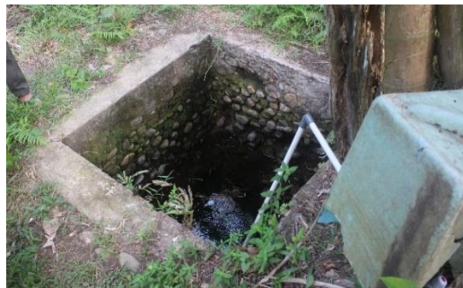
Gambar 2. Bunker Jepang di Desa Wisata Sintuk

Benteng dan bunker Jepang adalah bentuk bangunan pertahanan fisik yang didirikan oleh kemiliteran Jepang, khususnya selama periode pendudukan tiga setengah tahun yang menentukan dalam sejarah Indonesia, seiring dengan usaha Jepang membangun imperium di Asia dan meletuskan Perang Pasifik (Harianti, 2007; Posponegoro, 2008). Secara definitif, benteng diartikan sebagai bangunan pertahanan yang terdiri dari ruang tertutup, yang sebagian atau keseluruhannya tertanam dalam tanah, berfungsi untuk berlindung dan bertahan dari serangan musuh (Kementerian Kebudayaan dan Pariwisata, 2004). Sementara itu, bunker juga diartikan sebagai bangunan pertahanan yang secara teknologis dibuat menggunakan bahan cor semen (Chawari, 2015).