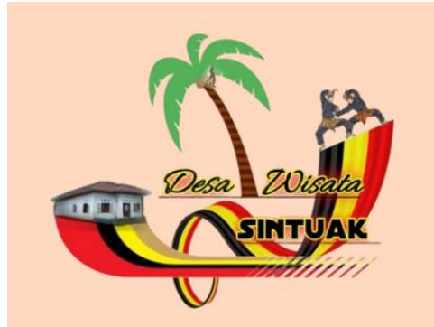
Gambar 1. Logo Desa Wisata Sintuk