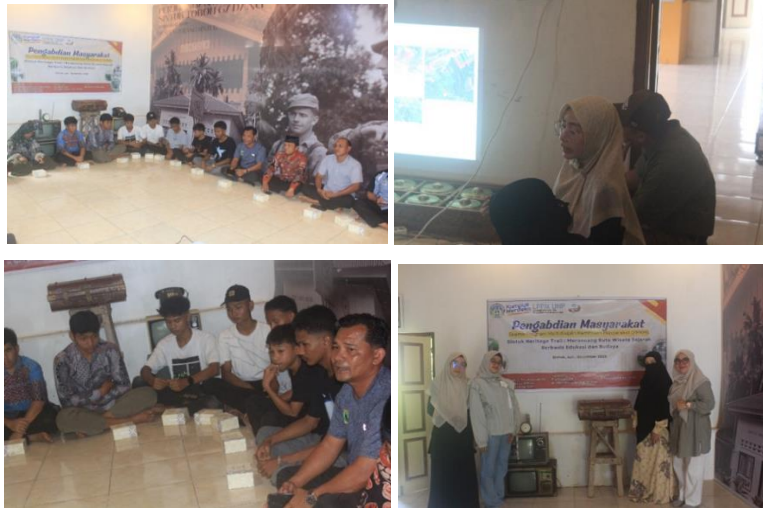
Gambar 4. Dokumentasi Kegiatan Sosialisasi

Kegiatan pemaparan potensi wisata sejarah yang dimiliki oleh Nagari Sintuk ini telah berhasil terlaksana selama dua hari penuh, yaitu mulai dari Hari Jumat, 22 Agustus 2025, hingga Hari Sabtu, 23 Agustus 2025. Tujuan utama dari kegiatan ini adalah untuk mensosialisasikan dan menguatkan pemahaman mengenai potensi besar wisata sejarah yang ada di Nagari Sintuk, khususnya mengingat Sintuk telah resmi ditetapkan sebagai Desa Wisata Sintuk sejak tahun 2022 dengan fokus utama pada pelestarian budaya dan sejarah. Pentingnya kegiatan ini tercermin dari kehadiran berbagai pemangku kepentingan utama di Nagari Sintuk, termasuk Wali Nagari Sintuk, Wali Korong Sintuk, Ketua Pokdarwis Sintuk, Kepala Pemuda, Kepala KAN Sintuk, Niniak Mamak, dan Pengurus Museum Perang Sintuk. Kehadiran representatif dari unsur pemerintahan, adat, dan pengelola pariwisata menunjukkan komitmen kolektif untuk mengembangkan dan melestarikan warisan sejarah Nagari Sintuk sebagai aset wisata.