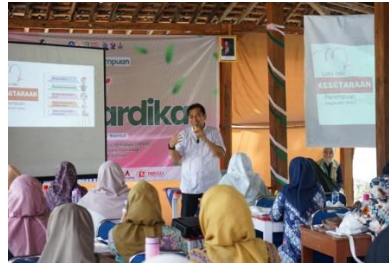
Gambar 1. Sesi Edukasi bersama HIMPSI

positif kepada sesama anggota kelompok sebagai bentuk dukungan, doa, dan semangat antar sesama perempuan.