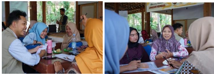
Gambar 2. Sesi sharing session bersama fasilitator

Sesi sharing berlangsung dengan lancar dan sesuai dengan yang diharapkan. Peserta menunjukkan antusiasme tinggi dalam menyampaikan pengalaman dan pandangannya mengenai kesetaraan gender. Salah satu peserta menyampaikan, “Biasanya di sini kalau ada musyawarah desa, pendapat perempuan sering dianggap setelah pendapat laki-laki. Setelah mengikuti kelas ini, semoga kami bisa belajar cara menyampaikan pendapat dengan lebih baik saat berdiskusi bersama laki-laki.” Antusiasme peserta selama sesi diskusi menunjukkan adanya keterbukaan terhadap topik kesetaraan gender yang sebelumnya masih jarang dibicarakan di lingkungan masyarakat desa. Hal ini mengindikasikan bahwa pendekatan dan suasana pembelajaran yang telah dilaksanakan efektif dalam menciptakan tempat yang aman serta membantu menumbuhkan kesadaran peserta terhadap isu kesetaraan gender.