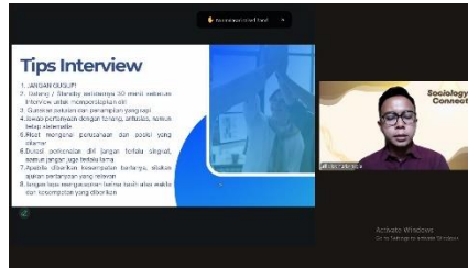
Gambar 2. Sesi Pelatihan Teknik Interview

dapat terlihat bahwa motivasi mahasiswa mulai meningkat, selain itu kondisi ini dapat mandakan bahwa mahasiswa mulai menganggap alumni sebagai figur teladan atau role model mereka. Dengan adanya role model maka mahasiswa akan cenderung mulai melakukan modeling (peniruan), yang kemudian berlanjut dengan internalisasi nilai untuk mempersiapkan karir mereka (Ulandari & Farozin 2023).