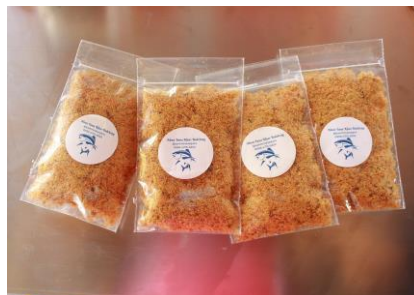
Gambar 3. Abon Ikan