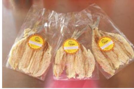
Gambar 4. Sudang Lepet

Hasil evaluasi menunjukkan bahwa sebanyak 80% anggota kelompok mampu menerapkan prosedur GMP secara mandiri, seperti penggunaan alat berbahan food grade , pemisahan area produksi, dan penerapan hygiene pekerja selama proses pengolahan. Implementasi tersebut berdampak pada peningkatan higienitas proses produksi, penurunan risiko kontaminasi silang, serta peningkatan keseragaman mutu produk olahan ikan. Selain itu, penggunaan alat produksi yang lebih sesuai standar membantu kelompok menjalankan proses produksi secara lebih efisien dan terstruktur.