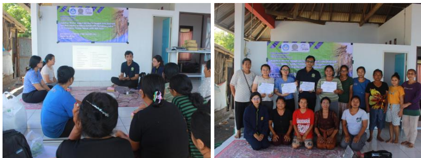
Gambar 2. Dokumentasi Kegiatan Pelatihan

Kegiatan ini dilaksanakan pada 26 Oktober 2025 bertempat di Balai Kelompok Sari Mina Segara, Banjar Dinas Pabean, Desa Sangsit, Kecamatan Sawan, Kabupaten Buleleng. Kegiatan ini bertujuan untuk meningkatkan efektivitas penerapan GMP melalui penyediaan fasilitas yang sesuai standar sekaligus memberikan pengalaman langsung kepada mitra dalam penerapannya di lapangan. Pada kegiatan ini, tim pengabdian menyerahkan sejumlah alat pendukung produksi seperti meja stainless, cool box, kontainer penyimpanan bahan, nampan stainless , apron kitchen , hand gloves , dan hair net yang berfungsi untuk menunjang pelaksanaan proses produksi yang higienis dan efisien. Selain penyerahan alat, peserta juga mendapatkan pelatihan praktik penerapan GMP secara langsung, termasuk pelatihan penggunaan dan perawatan peralatan, serta demonstrasi alur proses produksi yang sesuai dengan standar keamanan pangan. Dokumentasi kegiatan pelatihan, penyerahan alat, serta praktik penerapan GMP dapat dilihat pada Gambar 2 produk akhir dapat dilihat pada Gambar 3 dan 4.