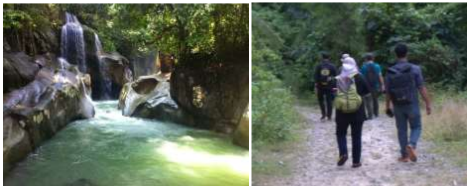
Gambar 1 (a) Lokasi Nyarai (b) Kegiatan Susur Jalur Wisata Nyarai

Titik rest area dan situs atraksi tercapat ada beberapa situs. Hal tersebut diantaranya, posko utama, camping ground, lubuk batu tudung, posko 2, lubuk sikayan kudu, posko 3, batu gantung, makam PRRI dan Nyarai. Semua titik tersebut sudah diambil titik koordinatnya menggunakan GPS yang menghasilkan data .kml dan gambar lokasi. Keduanya itu digunakan untuk memvisualisasikan data lapangan ke aplikasi pemetaan.