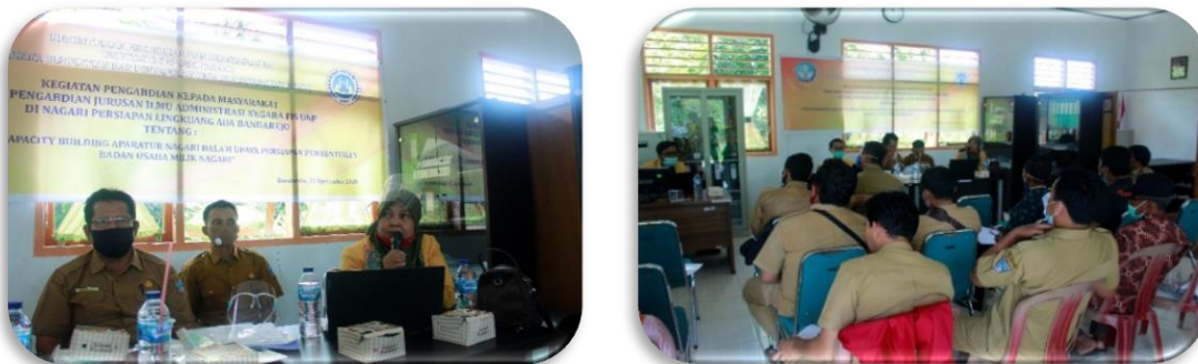
Gambar 4. Penyampaian Materi; Peserta Mendengarkan Pemaparan Materi dari Narasumber dan Diskusi