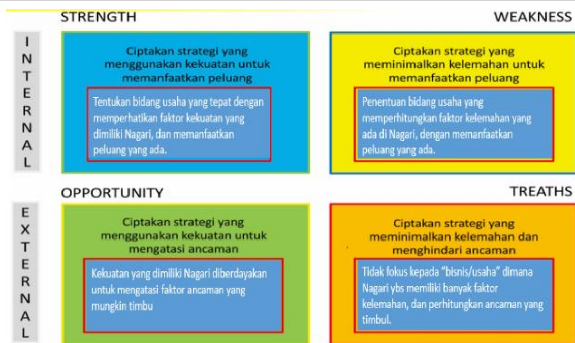
Gambar 5. Teknik Analisis SWOT