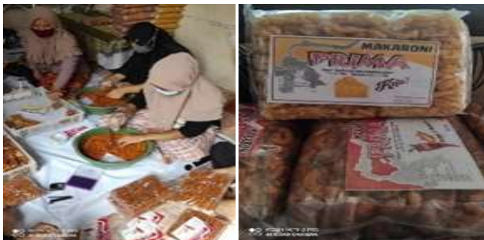
Gambar 1. Produk dan aktivitas Kelompok Usaha Makaroni Prima

Bahwa untuk kebutuhan pemasaran ditengah pandemic Covid-19 dibutuhkan suatu teknologi manajemen pemasaran yang bisa lebih mudah digunakan dan pemanfaatannya. dan mungkin belnasungs seterusnya. Ternyata pemasaran melalaui digita sangat memengaruhi.