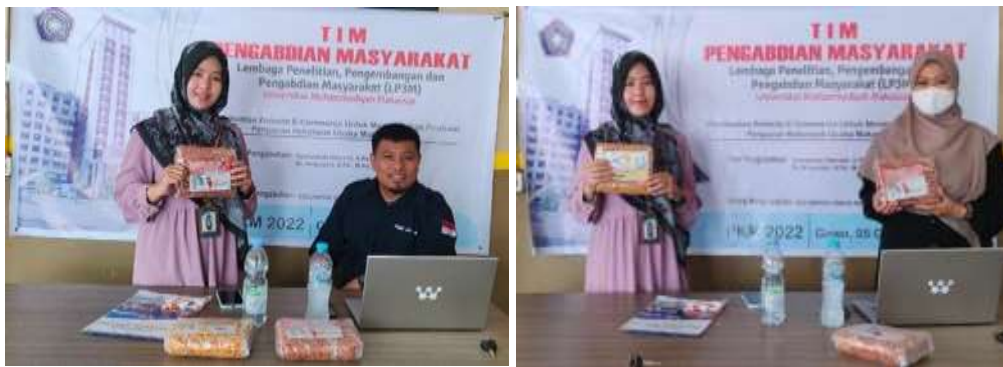
Gambar 2. Pelatihan dan Media Publikasi Berita Online

Setelah melakukan observasi, wawancara dan diskusi bersama Kelompok Usaha Makaroni Prima TIM pengabdian masyarakat melakukan sosialisasi dan pelatihan pembuatan dan penggunaan website berbasis e-commerce sebagai tempat promosi atau penjualan produk Kelompok Usaha Makaroni Prima.