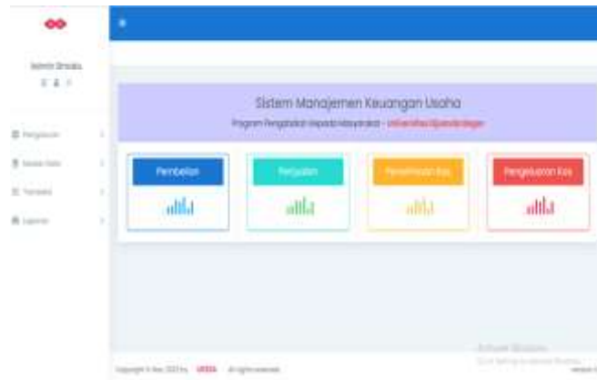
Gambar 2. Menu Aplikasi SIMAKU

dari kebutuhan akan pengelolaan keuangan yang praktis dan mudah digunakan oleh pengelola unit usaha BMT yang memiliki latar belakang pendidikan mulai dari lulusan SMP sampai dengan lulusan SMA. Secara umum pengelola tersebut kesulitan dalam melakukan pelaporan keuangan sehingga hal ini mendorong untuk menyusun sistem aplikasi manajemen usaha yang sederhana namun memenuhi semua kebutuhan BMT Kabandungan. Aplikasi SIMAKU terdiri dari pembelian, penjualan, penerimaan kas dan pengeluaran kas. Seperti terlihat pada gambar 2 dibawah ini.