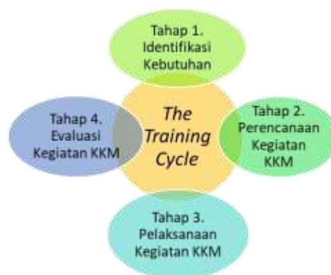
Gambar 1. Tahapan Pengabdian Masyarakat Pendekatan The Training Cycle

Tahapan pelaksanaan kegiatan pengabdian kepada masyarakat ini menggunakan pendekatan The Training Cycle . Tahap yang dilakukan adalah identifikasi kebutuhan pelatihan, menetapkan tujuan pelatihan dan perencanaan, pelaksanaan pelatihan diakhiri dengan evaluasi. Berikut ini gambaran pendekatan the training cycle .