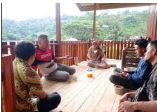
Gambar. 5 Kegiatan Survei Wawancara Awal dengan Pengelola BMT Kabandungan

Peningkatan keterampilan pengelola BMT Kabandungan dalam menggunakan SIMAKU dilakukan dengan melakukan pelatihan yang diselenggarakan pada tanggal 16-17 November 2022. Namun sebelum dilakukan pelatihan terlebih dahulu dilakukan survey dan Fokus Group Diskusi (FGD). Survey dilakukan pada tanggal 3 Desember 2022. Pada kegiatan survey dilakukan dengan melihat kondisi BMT, mengunjungi unit-unit usaha BMT dan mewawancarai anggota BMT. Selanjutnya juga dilakukan wawancara awal dengan pengelola BMT.