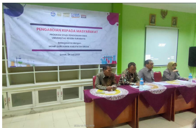
Gambar 2. Pembukaan PKM dihadiri Kepala SMAN 1 Gresik dan Ketua MGMP Kimia Kabupaten Gresik

Pelaksanaan PKM secara luring dimulai dengan pembukaan yang dihadiri kepala SMAN 1 Gresik, ketua MGMP, tim PKM dan guru kimia se Kabupaten Gresik. Suasana pembukaan PKM tersaji pada Gambar 2.