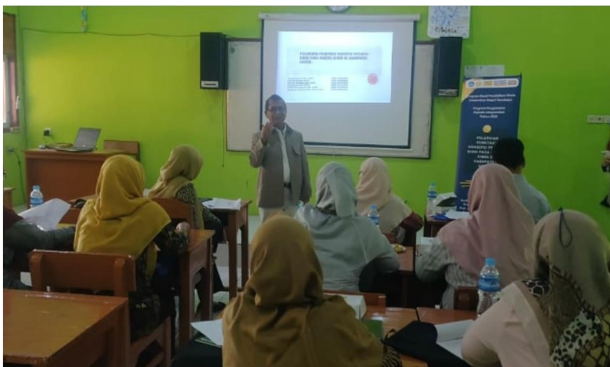
Gambar 3. Pelaksanaan PKM secara luring pada tahap 1

Secara umum, tes dua tingkat digambarkan sebagai instrumen diagnostik dengan tingkat pertama, termasuk pertanyaan konten pilihan ganda, dan tingkat kedua, termasuk serangkaian alasan pilihan ganda untuk jawaban tingkat pertama (Adadan and Savasci 2012). Pada tes tiga tingkat three tier test , tingkat pertama berupa tes pilihan ganda biasa, tingkat kedua berupa tes pilihan ganda yang menanyakan alasannya, dan tingkat ketiga berupa skala yang menanyakan tingkat kepercayaan siswa terhadap jawaban yang diberikan untuk dua di atas (Gurel, Eryilmaz and McDermott 2015). Tes diagnostic miskonsepsi selanjutnya adalah four-tier test . Tes diagnostik ini merupakan versi yang disempurnakan dari two-tier test . Tes ini meliputi tingkatan jawaban (tier 1), tingkat kepercayaan siswa pada kebenaran pilihan yang mereka pilih untuk tingkatan jawaban (tier 2), alasannya masing-masing mengukur pengetahuan konten dan pengetahuan penjas siswa (tier 3), dan tingkat kepercayaan untuk alasan (tier 4) (Caleon and Subramaniam 2010).