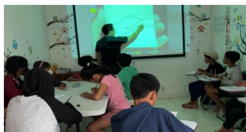
Gambar 4. Praktek pengajaran di BPC

Praktek dalam penyampaian materi dalam materi-materi yang diajarkan, secara langsung disampaikan oleh peneliti, baik itu secara verbal maupun secara non verbal, serta dalam praktek penggambaranya. Peneliti