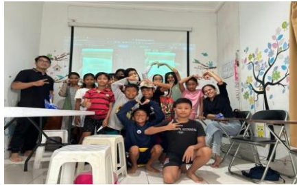
Gambar 5. Foto bersama di hari terakhir mengajar pada komunitas BPC

dalam pelaksanaannya sendiri juga terlibat dalam menggambar serta berkomunikasi dan membantu para siswa terkait hal-hal yang masih belum dimengerti ataupun kesusahan dalam penggambaran tersebut. Perlu diketahui juga bahwa siswa dalam belajar tidak bisa disamakan, karena mereka punya cara berpikir yang berbeda, dan hal secara berpikir tidak bisa disamakan untuk semua siswa, tetapi juga harus diperhatikan apakah mereka bisa menangkapnya dan lebih mudah menghafal. Didalam pelatihan ini dibuat metode pembelajaran Flip Book untuk melihat apakah siswa-siswi bisa merasakan manfaat dari metode tersebut. Seperti halnya yang dikatakan oleh Asela et al (2020) Siswa pun berbeda-beda satu dengan yang lain, ada yang belajar dapat mengerti hanya dengan menghafal, tetapi ada juga yang perlu melihat secara visual, karena itu pembelajaran yang bersifat visual pun juga diperlukan. Tak jarang, siswa visual yang lebih mudah menerima materi dalam bentuk bagan dan gambar sulit untuk menerima penjelasan-penjelasan lisan tersebut. Oleh karena itu perlu diperhatikan juga bahwa dalam pembelajaran siswa, terutama siswa SD perlu adanya metode yang mendukung keinginan para siswa dalam pembelajaran sehingga dapat dinikmati lebih lagi.