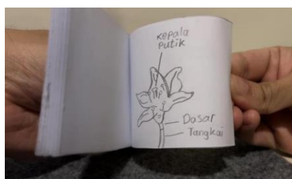
Gambar 1. Bentuk Flip Book

Pelatihan yang dilakukan adalah dengan pembuatan media pembelajaran Flip Book, dimana anak-anak menggambar sambil belajar melalui Flip Book itu sendiri, akan diberikan materi yang mau diajarkan, lalu anak-anak akan mulai mengikuti dan menggambar sesuai dengan apa yang telah diberikan, yaitu melalui pembelajaran IPA (Ilmu Pengetahuan Alam) karena pelajaran IPA merupakan salah satu pelajaran yang mudah diaplikasikan dalam Flip Book (Sari & Atmojo, 2021). Pelatihan dijalankan selama 2 hari yang dilaksanakan di kota Gereja GKA Zion Singaraja, provinsi Bali. Pelatihan pembelajaran metode Flip Book ini diikuti oleh 13 siswa yang berasal dari kelas 4, 5 dan 6 SD, pada hari pertama di tanggal 5 februari 2024 dan pada hari kedua pada tanggal 7 Februari 2024, dalam pembelajaran para siswa mendapatkan materi dari peneliti pada awal kelas dimulai, lalu dilanjutkan dengan para siswa melakukan praktek menggambar tersebut dalam Flip Book dengan materi yang diberikan mulai dari penggambaran serta deskripsi dari gambar, yang tentu saja juga sudah diberikan gambaran dahulu oleh peneliti, sehingga semua siswa dapat mengikuti.