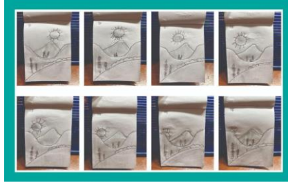
Gambar 2. Contoh hasil karya Gerak semu Matahari