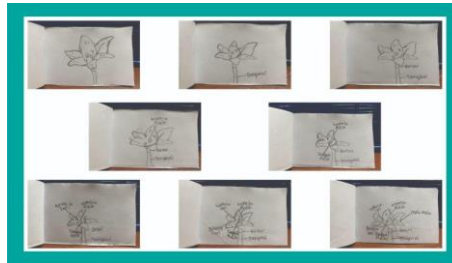
Gambar 3. Contoh hasil karya bagian-bagian bunga