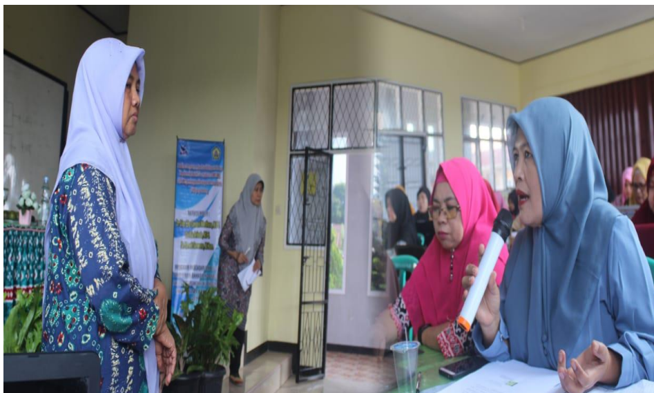
Gambar 4. Foto pada saat pelaksanaan kegiatan

hal yang dievaluasi pada tahap pelaksanaan pelatihan meliputi: (Evaluasi Peserta, menyangkut: (1) penguasaan materi ; (2) kedisiplinan; (3) ketertiban; dan (4) sikap); Evaluasi Fasilitator, menyangkut (penguasaan materi ; kesesuaian materi dengan topik bahasan yang disampaikan; ketepatan metode yang digunakan ; kesesuaian media yang digunakan; penampilan ; penggunaan bahasa) ; Evaluasi Penyelenggaraan, menyangkut kebersihan ruang pelatihan, akomodasi dan konsumsi, serta pelayanan Panitia. Pelaksanaan kegiatan pengabdian dapat di lihat pada Gambar 4.