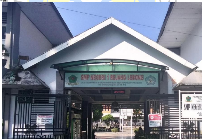
Gambar 2. Sekolah Tempat Kegiatan Pengabdian

Tempat kegiatan di SMPN 1 Rejang Lebong seperti yang direkomendasikan oleh Kepala Dinas Rejang Lebong. Pelaksanaan pengabdian pada hari Sabtu, tanggal 9 November 2019. Foto tempat kegiatan pengabdian dapat dibaca pada gambar 1. Tempat pengabdian beralamat di kota curup atau kota Rejang Lebong.