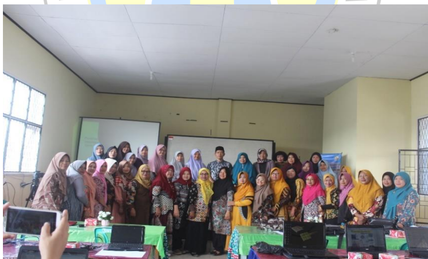
Gambar 3. Foto bersama Kabid Ketenagaan, Tim Pengabdian dan subyek pengabdian

Pelaksanaan kegiatan pengabdian oleh tim pengabdian dari Program Magister Pascasarjana Pendidikan Bahasa Indonesia dilaksanakan dengan semangat tinggi, karena kondisi cuaca yang cerah, ditambah dengan kondisi ruangan yang representatif sangat bersih, meja tertata rapi, pencahayaan cukup, tersedia LCD sehingga subyek pengabdian dapat memanfaatkan laptop untuk merealisasikan materi kegiatan pengabdian. Ketiga tim pengabdian secara antusias melaksanakan diskusi dan secara sambung menyambung saling mengisi menyampaikan materi. Pelaksanaan pengabdian menggunakan metode eklektik, dan diakhiri dengan menyebarkan lembar tanya ( post test ), serta daftar tanya evaluasi kegiatan (kepada panitia pelaksana, 3 orang dan peserta 3 orang), dengan tujuan mencari masukan untuk kegiatan pengabdian di periode yang akan datang. Guru-guru diberikan pre-test dan post-test untuk melihat kemampuan awal dan sebagai evaluasi kemampuan guru sebelum dan sesudah pemberian materi dan pelatihan. (Muspita, R., Efrina, E., Fernandes, R., Putera, A. S., & Mahdi, A., 2019)