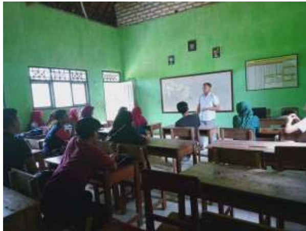
Gambar 4. Pendampingan dan Pelatihan Pengusaha Home Industry Di Desa Bandang Daja

produknya bukan hanya di dalam negeri tetapi juga dilakukan ke luar negeri (Amelia, Prasetyo, & Maharani, 2017). Di sisi lain, menurut Anugrah (2020) dengan pemanfaatan media sosial dapat juga memperoleh keuntungan yang lebih, dikarenakan mereka dapat melakukan komunikasi lebih dekat dengan pelanggan dan sebagian masyarakat yang kini cenderung lebih banyak menghabiskan waktunya dengan penggunaan media sosial. Sehingga pelaku home industry dapat berpeluang memenuhi capaian target pemasaran produk mereka sekaligus dapat menyelamatkan atau bahkan meningkatkan kondisi ekonomi masyarakat di tengah pandemi Covid-19.