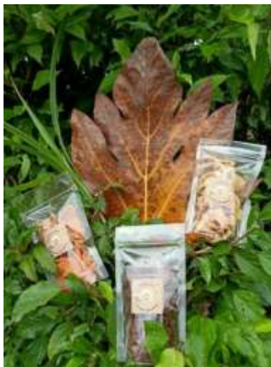
Gambar 3. Contoh Hasil kreativitas Home Industry dari desa Bandang Daja

Bagian akhir peserta home industry Desa bandang Daja memperoleh banyak informasi mengenai strategi marketing untuk beradaptasi di masa pandemi COVID-19 ini dan pemanfaatan aplikasi Canva serta media sosial instagram dan Tik-Tok dari pelaksanaan kegiatan pengabdian. Setiap pemilik home industry melakukan praktek penggunaan Canva dan Sosial Media dari membuat akun sampai dengan aplikasi untuk strategi pemasaran di era digital saat ini. Setelah dilakukan praktek, pada akhir sesi, kami juga memberikan angket umpan balik dengan tujuan untuk mengetahui tingkat pemahaman peserta terhadap kegiatan praktek. Berikut hasil analisis dari angket yang dibagikan. Berdasarkan hasil angket yang diberikan, pada tahap praktek, dan sebanyak 10 respon pemilik home industry terhadap sesi praktek sebanyak 9 peserta (90%) sangat paham dan sebanyak 1 peserta (10%) paham (Gambar 2).