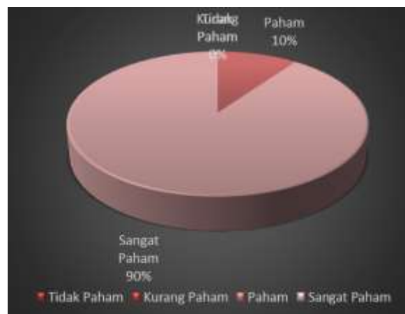
Gambar 1. Diagram Tingkat Pemahaman Peserta Terhadap Materi Pelatihan

Home industry merupakan salah satu bagian dari pengelompokan industry berdasarkan kapasitas pekerja, hanya memiliki \leq 4 orang dengan aset serta modal yang belum bisa untuk ditentukan. Pada umumnya para pelaku home industry yang dijadikan masalah bagi mereka adalah untuk memulai berwirausaha, karena pada dasarnya untuk menjadi wirausahawan tidak cukup hanya bermodalkan keberanian tetapi juga membutuhkan motivasi serta komitmen untuk menjadi wirausahawan. Awal merintis usaha atau membuka usaha home indutry tidaklah semudah membalikan telapak tangan, jatuh bangun dalam usaha itu hal yang sangat wajar maka dari itu butuh sumber daya manusia yang pantang menyerah, pekerja keras dan berani mengambil risiko, agar home industrinya tetap eksis. Apalagi wirausaha home industry didesa yang produksinya musiman tentu butuh daya juang yang luar biasa, karena untuk memasarkan hasil produksinya harus bersaing dengan produksi barang baru yang secara harga juga mampu bersaing.