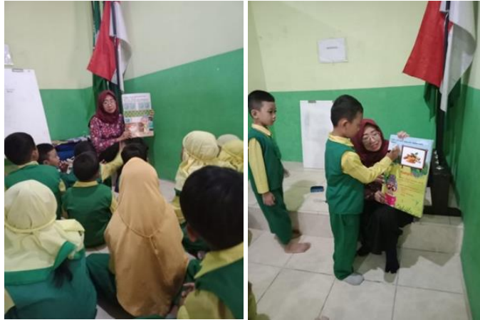
Gambar 2. Pemateri Menerangkan Materi Dengan Menggunakan Media Big Book dan Lagu

Di dalam buku cerita ini terdapat banyak aktifitas sehingga secara interaktif anak-anak langsung secara bergantian mengerjakan aktivitas yang ada di Big Book ini. Kegiatan bercerita menggunakan media Big Book sendiri akan berhasil atau tidak dipengaruhi oleh komunikasi yang dilakukan guru atau pendidik. Hal ini sesuai dengan pendapat dari (Fitriani et al, 2019) yang mengatakan bahwa sebagai seorang pendidik anak usia dini, pendidik di tuntut untuk mampu melakukan komunikasi secara demokratis dan menggunakan bentuk pertanyaan terbuka serta mampu menggunakan media-media kreatif dalam proses pembelajaran. Gaya komunikasi demokratis ini akan membantu anak dalam mengekspresikan dirinya melalui bahasa, terlebih dengan penggunaan bentuk pertanyaan yang mengajak anak untuk memberikan jawaban yang luas dan tidak terbatas pada jawaban ya atau tidak, atau jawaban singkat.