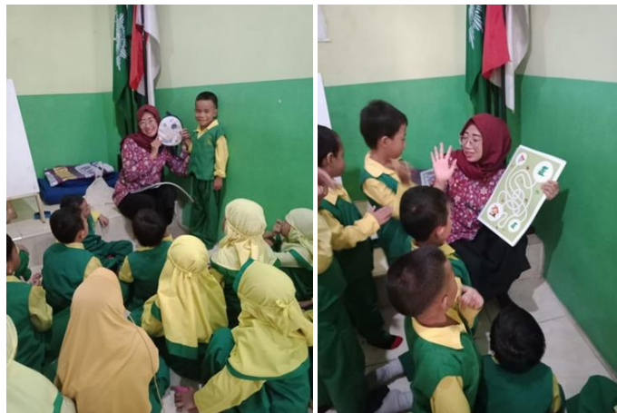
Gambar 3. Para Peserta Berinteraksi dengan Pemateri

Big Book ini dilengkapi pula dengan QR Code. QR Code menurut Rouillard dalam Yazid et al (2023) merupakan teknik yang mengubah data tertulis menjadi kode-kode 2-dimensi yang tercetak kedalam suatu media yang lebih ringkas. QR Code adalah barcode 2-dimensi yang diperkenalkan pertama kali oleh perusahaan Jepang Denso-Wave pada tahun 1994. Barcode ini pertama kali digunakan untuk pendataan inventaris produksi suku cadang kendaraan dan sekarang sudah digunakan dalam berbagai bidang. QR adalah singkatan dari Quick Response karena ditujukan untuk diterjemahkan isinya dengan cepat. QR Code ini ketika di scan akan muncul musik beserta lagu tentang Toga. Lalu kami bernyanyi bersama anak-anak dan guru di tempat mitra. Metode bernyanyi ini sendiri pada pembelajaran usia dini memiliki banyak manfaat untuk praktik pendidikan anak dan pengembangan pribadi anak secara luas (Kamtini & Sitompul, 2019). Sebuah konsep akan lebih mudah pula ditanamkan lewat lagu karena diucapkan berkali-kali dan akan lebih baik lagi apabila pemilihan lagu untuk anak usia dini memenuhi kriteria yang sesuai dengan kebutuhan anak seperti lirik sederhana dan mudah dipahami anak dan nada yang menarik dan tidak terlalu sulit (Darmayanti et al, 2022).